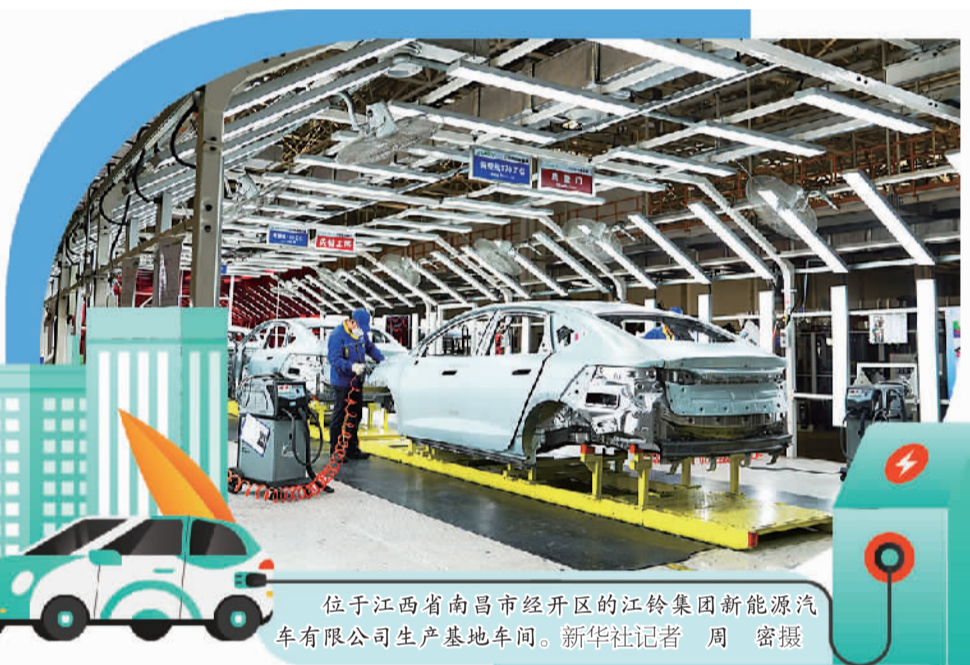
位于江西省南昌市经开区的江铃集团新能源汽车有限公司生产基地车间。