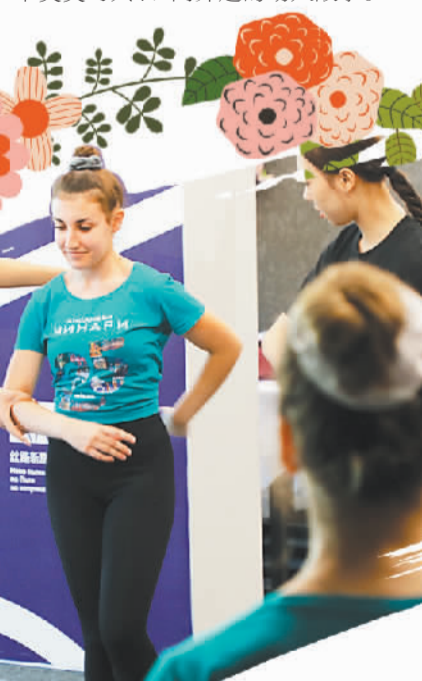
在“中保民族民间舞蹈对话工作坊”上,中国舞蹈老师对保加利亚舞者进行动作指导。

从传播到交融,中国与保加利亚这两大古老文明,正讲述着一个美美与共、双向奔赴的动人故事。