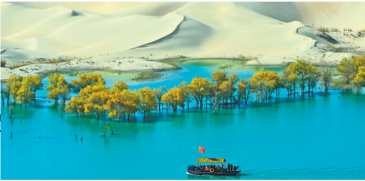
10月22日,新疆巴音郭楞蒙古自治州尉犁县胡杨林景区,湖泊、沙漠、胡杨相互映衬,游客乘船观赏秋日大漠风光。

据了解,对部分已成熟秋作物和倒伏玉米,河南各地农业农村部门积极指导农民抓住降雨间隙抢时收获,防止霉变发芽;对尚未成熟秋作物和站秆能力强的玉米,指导农民适时晚收,防止因盲目抢收造成晾晒困难;对部分玉米已经成熟、机械无法下地的,组织人工抢收。