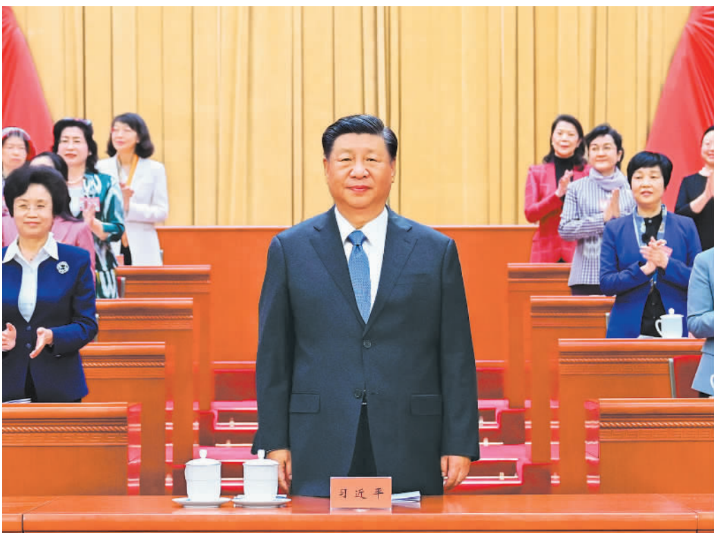
左图 10月23日,中国妇女第十三次全国代表大会在北京人民大会堂开幕。这是中共中央总书记、国家主席、中央军委主席习近平在主席台与会代表致意。