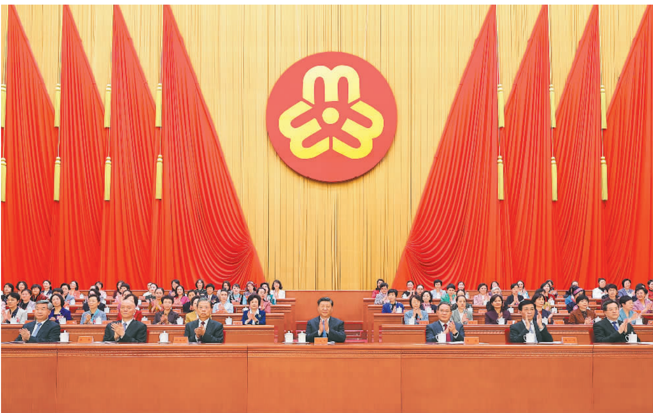
下图 10月23日,中国妇女第十三次全国代表大会在北京人民大会堂开幕。习近平、李强、赵乐际、王沪宁、蔡奇、丁薛祥、李希等在主席台就座,祝贺大会召开。

新华社北京10月23日电 中国妇女第十三次全国代表大会23日上午在人民大会堂开幕。习近平、李强、赵乐际、王沪宁、蔡奇、李希等党和国家领导人到会祝贺,丁薛祥代表党中央致词。 人民大会堂大礼堂气氛庄重热烈。主席台上方悬挂着“中国妇女第十三次全国代表大会”会标,后幕正中是鲜艳的中华全国妇女联合会会徽,10面红旗分列两侧。二楼眺台悬挂着“以习近平新时代中国特色社会主义思想为指导,全面贯彻党的二十大精神,动员引领各族各界妇女为全面建设社会主义现代化国家、全面推进中华民族伟大复兴而团结奋斗!”巨型横幅。 近1800名来自全国各行各业的中