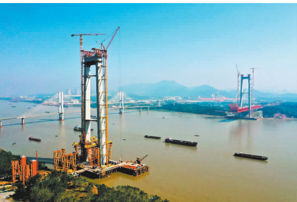
10月16日，建设中的京台高速铜陵长江公铁大桥。大桥全长11.88公里，具有高速公路、城际铁路和货运铁路3种过江功能，建成后将进一步完善国家和安徽省的高速公路网，对提升区域过江通道通行能力具有重要意义。

盘活闲置农房，不能只盯着一间房屋做文章，还需要在增强整个乡村的吸引力上找突破口，不能不管条件是否具备，一哄而上搞民宿。闲置农房散落于广袤乡村，盘活的方式多种多样，关键是要找准适合自己的方式，要从实际情况出发，要有整体谋划理念。农村房屋是乡愁记忆的重要组成部分，如何保持乡风乡貌、保留乡情乡愁，做好生态环境保护等，都是时刻需要放在心上的问题。