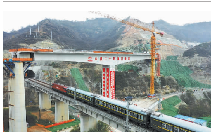
10月25日,中鐵二十局集團承建的西(安)延(安)高鐵路口鎮北洛河特大橋連續梁成功轉體,標志著西延高鐵路建設取得突破性進展。鐵路通車后,兩地運行時間將縮短至約1小時。

面對國際社會的強烈反對,美國曾辯稱,對津制裁只針對個人和實體,不針對普通民眾。這樣的辯解不符合事實,也折射出美方一些人的底氣不足。美國等部分西方國家的制裁具有強烈的連帶效應。制裁導致許多企業因害怕被罰,斷絕了與津巴布韋的商貿往來,進而影響津巴布韋經濟發展,也讓當地民眾的利益遭到嚴重損害。津巴布韋政府人士