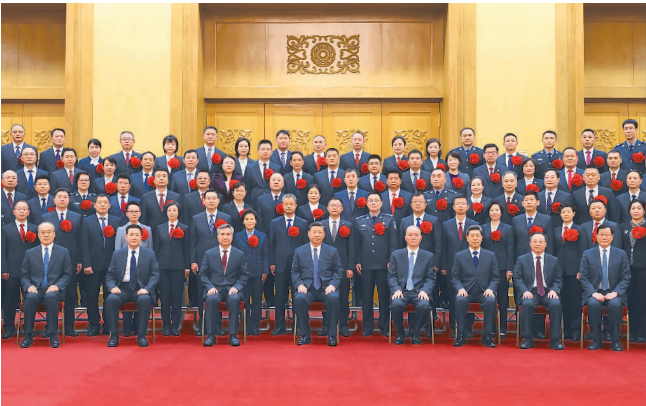
11月6日,党和国家领导人习近平、蔡奇、李希等在北京人民大会堂会见全国“枫桥式工作法”入选单位代表。