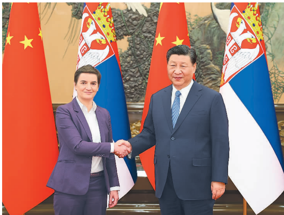
11月6日下午,国家主席习近平在北京人民大会堂会见塞尔维亚总理布尔纳比奇。