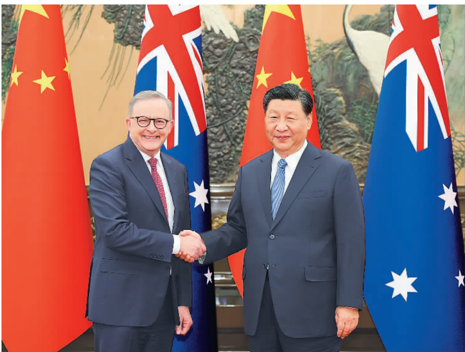
11月6日下午,国家主席习近平在北京人民大会堂会见来华进行正式访问的澳大利亚总理阿尔巴尼斯。