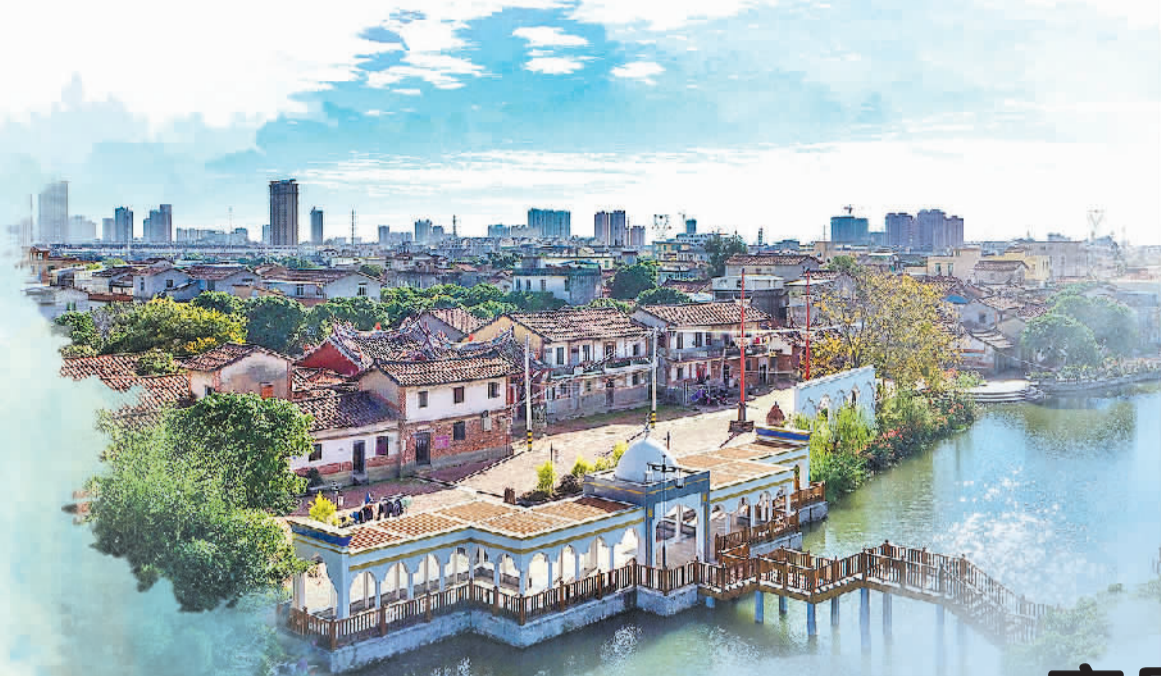
位于莆田木兰溪下游的双福村。