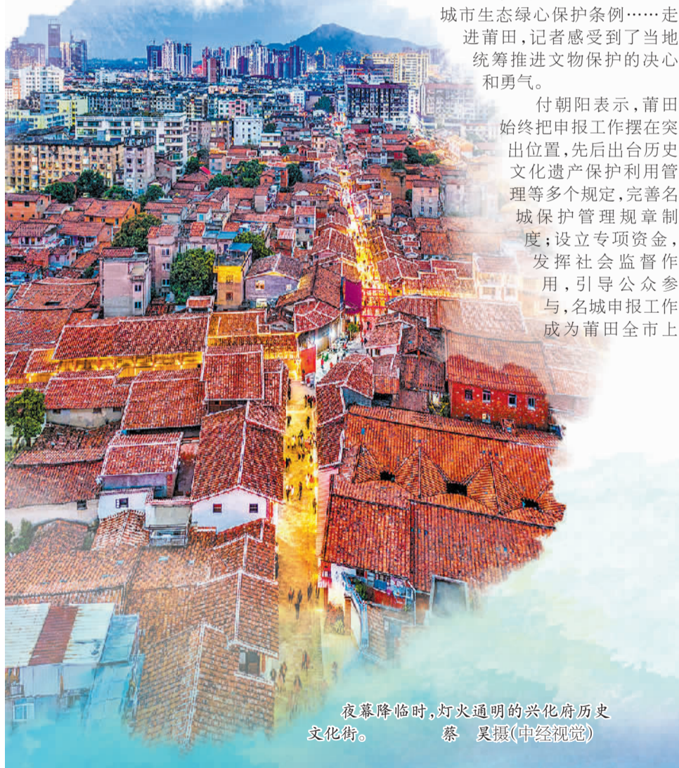
夜幕降临时,灯火通明的兴化府历史文化街。

“国家历史文化名城是沉甸甸的国字号‘金字招牌’,既是荣誉,更是责任。”付朝阳表示,下一步,莆田将以更高的站位、更大的格局、更浓的情怀、更实的举措,全力抓好历史文化资源保护传承工作,让文物和文化遗产焕发新时代光彩,实现妈祖故里文化名城、山水诗画生态韵城、匠心智造产业新城、通江达海战略港城“四城辉映”,更好赋能绿色高质量发展先行市建设,努力为谱写中国式现代化福建篇章作出莆田新的更大贡献。