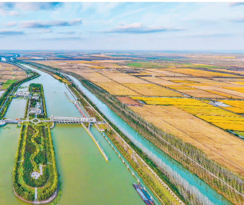
11月10日，江苏省宿迁市泗洪县南水北调泗洪站枢纽工程蔚为壮观，冬景如画。近年来，当地紧紧抓住南水北调的契机，不断加大水生态环境治理力度，严格落实县、乡、村三级河长制。同时，科学建设与保护水源地，实现了天蓝、水清、岸绿、景美。

绍，天津港集团积极落实国家“双碳”目标战略，实现100%绿电发自自用，各类设备全部采用电力驱动，建筑全部采用环保材料、节能工艺。在此基础上，还大力推广风能、光伏等新能源应用，全部滚装码头实现“零碳”运营。今年还将持续推动国际物流区域10兆瓦以及南疆港区25兆瓦分散式风电项目的建设，力争年底前实现分布式新能源发电系统总装机容量突破80兆瓦，努力将天津港打造成绿色港口。