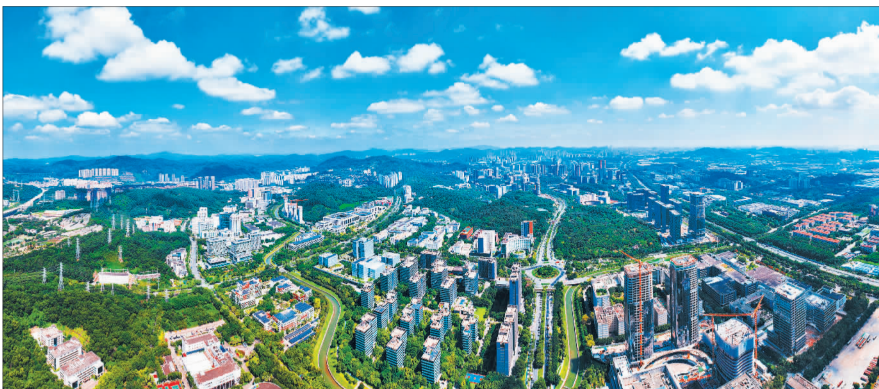
▲俯瞰广州开发区、黄埔区外景。该开发区80%以上的规上工业企业是中小企业，80%以上的高新技术企业是中小企业，80%以上的发明专利、创新成果和新产品来自中小企业。该区着力打造“中小企业能办大事”创新示范区。