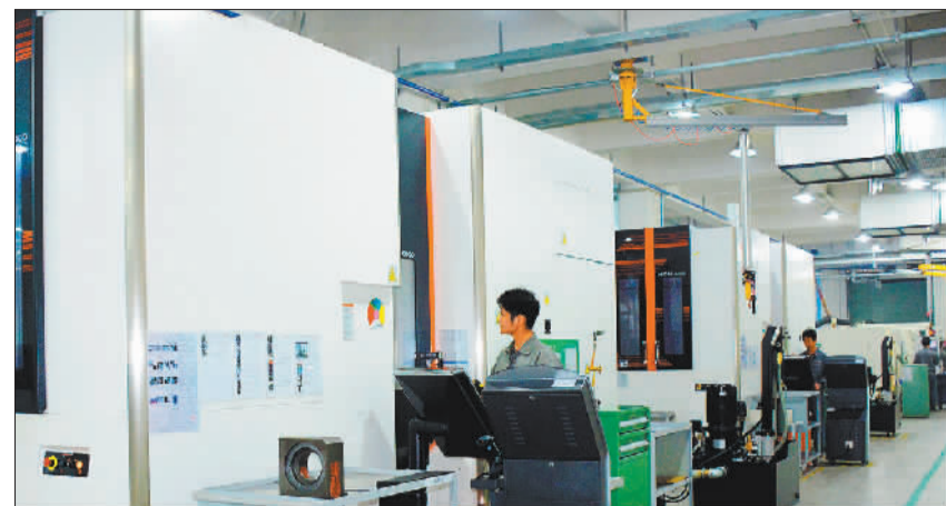
▼新落成投产的昊志禾丰智能制造产业园昊志机电车间内。该公司坚持自主创新，连续5年全球电主轴市场占有率第一。