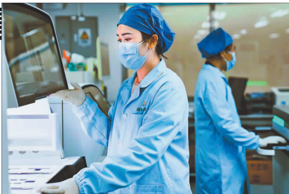
▲金城医学工作人员正在做相关实验。金城医学探索生物技术与新一代信息技术融合创新，进一步解决临床诊断难题。

当前，广州开发区着力激活改革、开放、创新“三大动力”，推动更多中小企业“小升规”、“规变强”、勇挑产业大梁，加速迈向“万亿制造”强区。