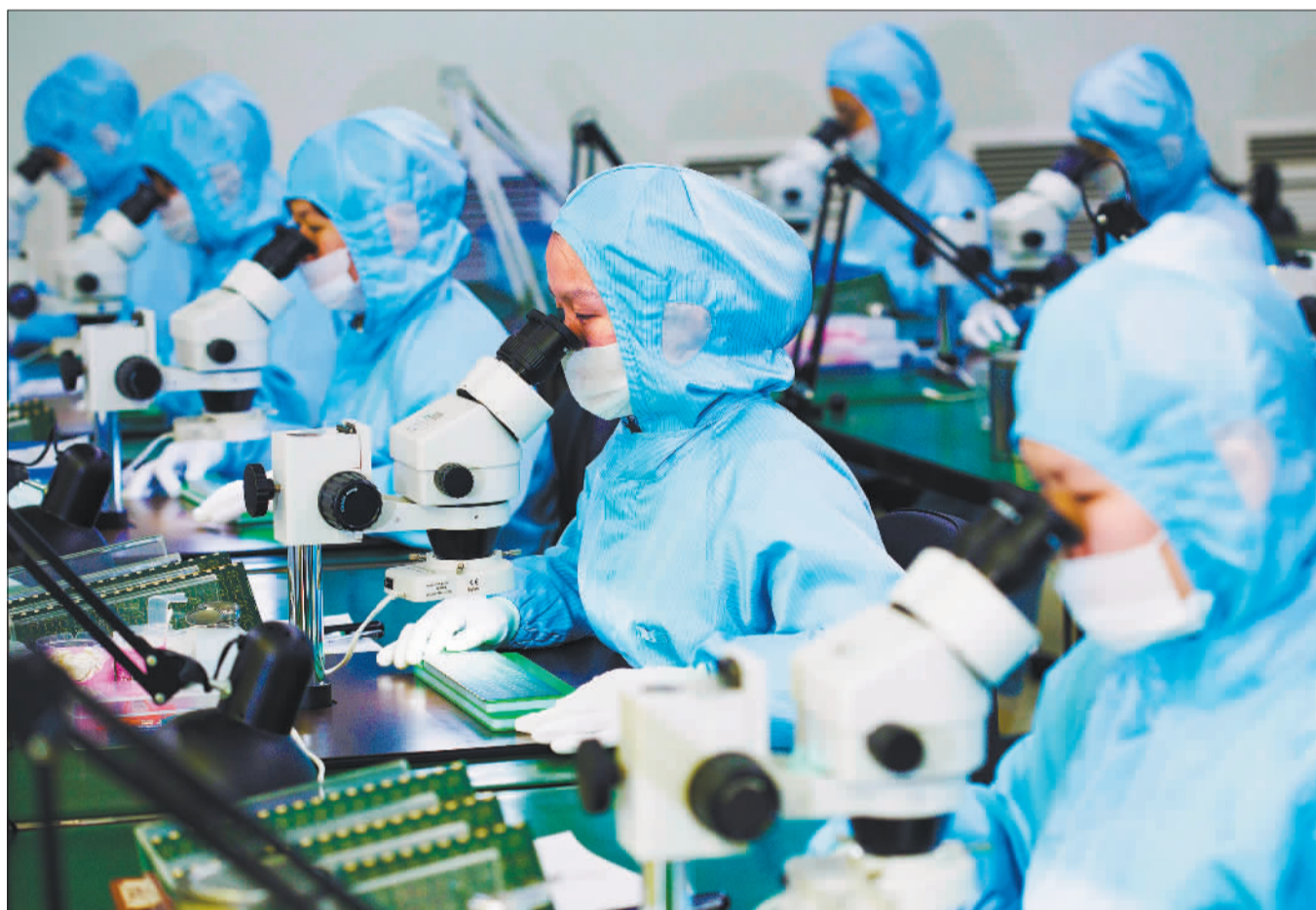
►广州视源电子科技有限公司，工程师调试、安装交互智能平板的电源芯片。该公司作为国内交互智能平板品类首创者，持续探索大数据、物联网、人工智能等数字技术运用。