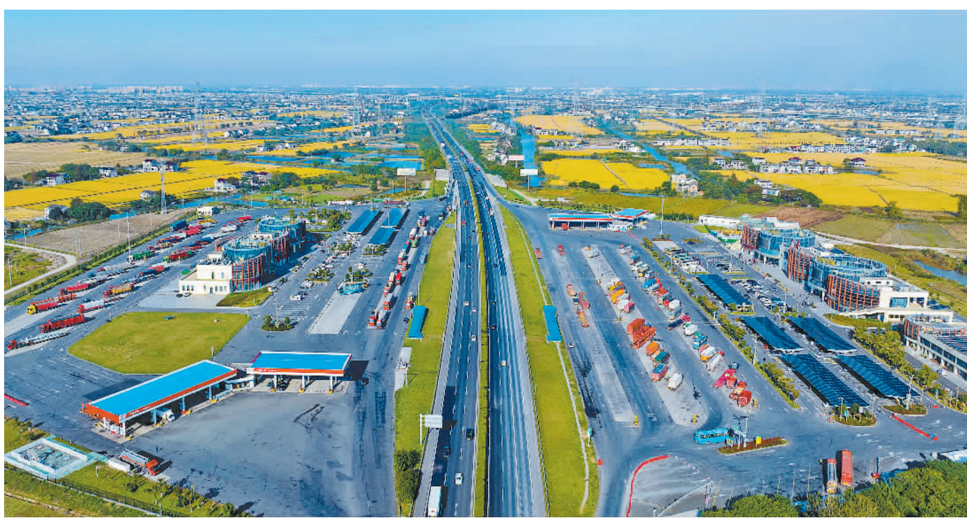
11月13日,江苏省规模最大的高速公路服务区光伏项目——沈海高速太仓市沙溪服务区分布式光伏项目日前建成投入使用。该项目总装机容量1372.8千瓦,预计年均发电量146万千瓦时,每年可节约标准煤450吨。

(新华社旧金山11月14日电 参与记者 杨士龙 吴晓凌 宿亮 缪晓娟 熊茂伶 杨淑君 袁秋岳 周思宇)