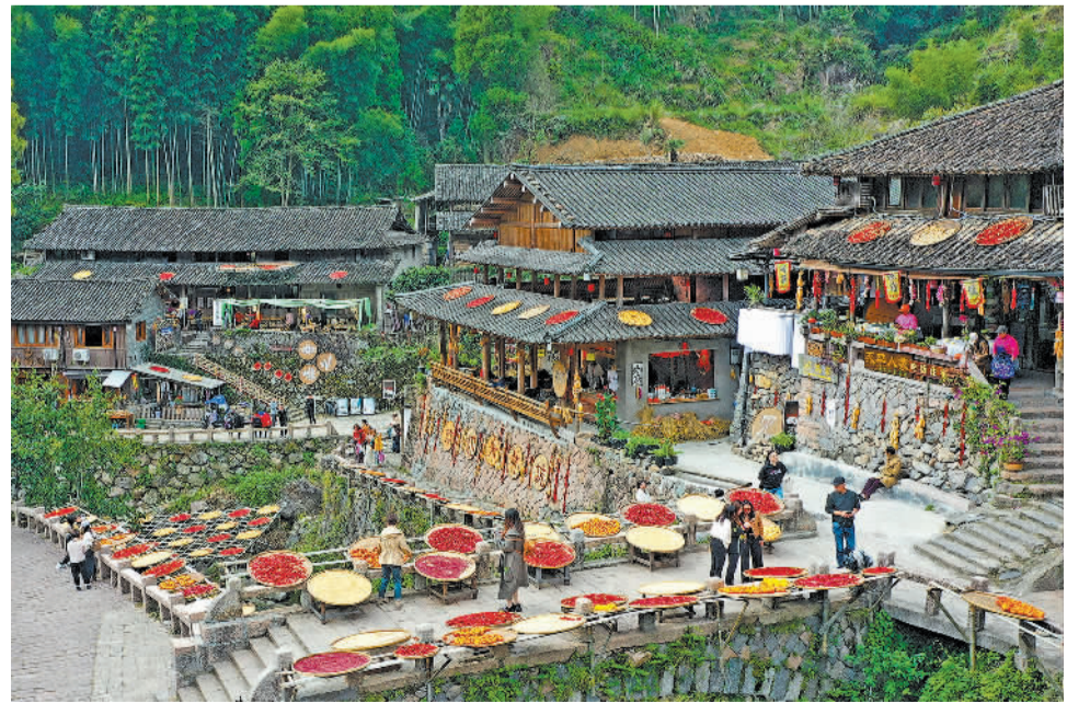
11月14日，浙江省温州市永嘉县岩坦镇林坑古村，房前屋后晾晒着红辣椒、玉米、南瓜等农作物，晒“秋”美景吸引许多游客前来观赏。近年来，岩坦镇立足古村特色发展乡村生态旅游，助力乡村振兴。

《报告》显示，数字经济企业TOP500区域分布呈现“东部领跑、中西部崛起、东北跟进”格局，企业规模呈现高营收、高市值“双高”特征。TOP500企业平均营收为1211亿元，其中万亿元级企业7家、千亿元级企业128家；TOP500企业平均市值(估值)为1781亿元，其中万亿元级企业17家、千亿元级企业162家。