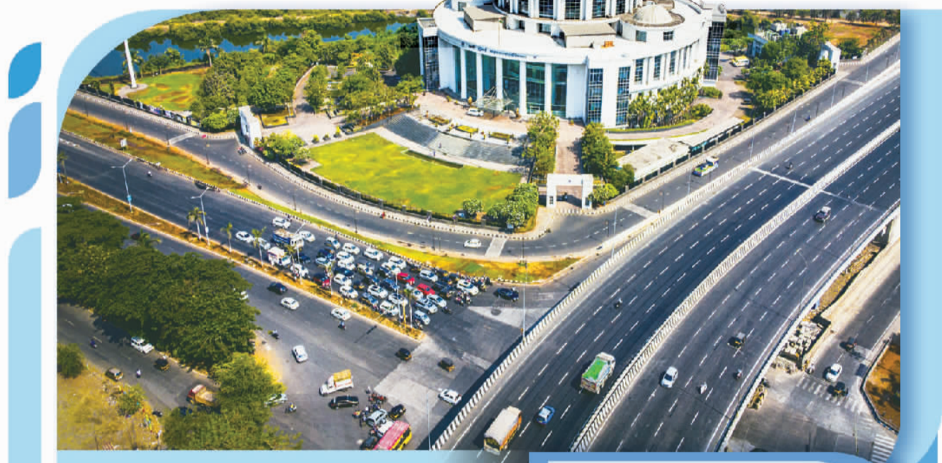
新孟买市市政合作大楼鸟瞰图。