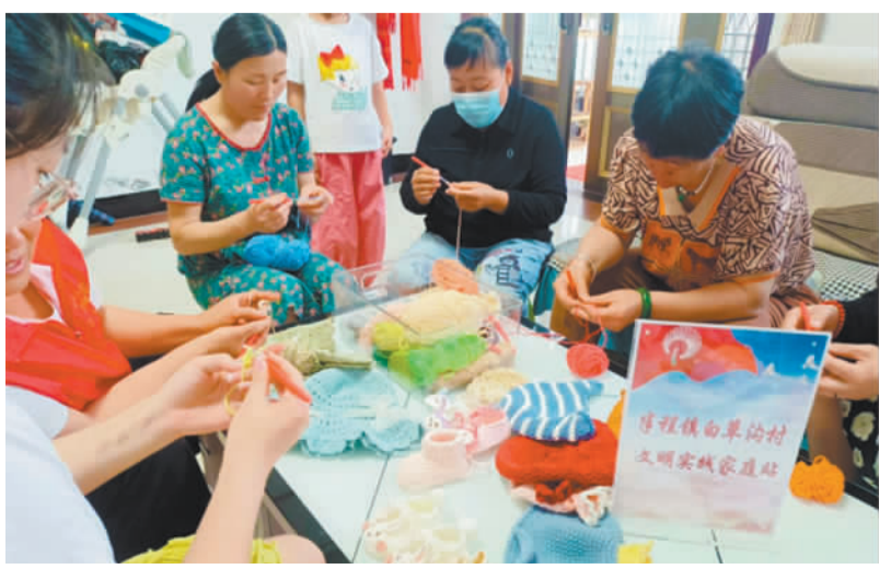
山东省临沂市兰山区半程镇文明实践家庭站