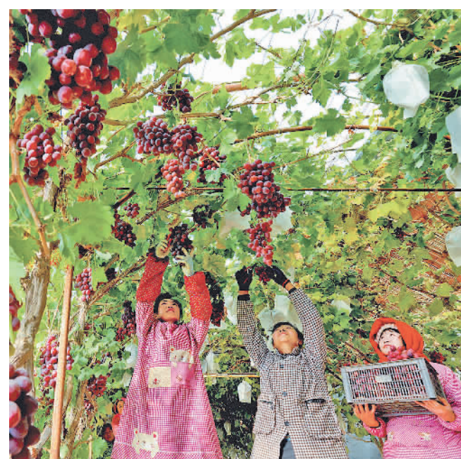
12月11日，甘肃省张掖市临泽县沙河镇兴科荒漠区设施农业示范园错季葡萄种植大棚内，种植户们在采摘葡萄，以保证明年元旦、春节节日市场供应。

随着“四好农村路”建设的稳步推进，布局合理、连接城乡、安全畅通、服务优质、绿色经济的农村交通网络将织密织牢，串联起遍布千山万水的村村寨寨，为推动农业农村现代化建设提供坚实保障。