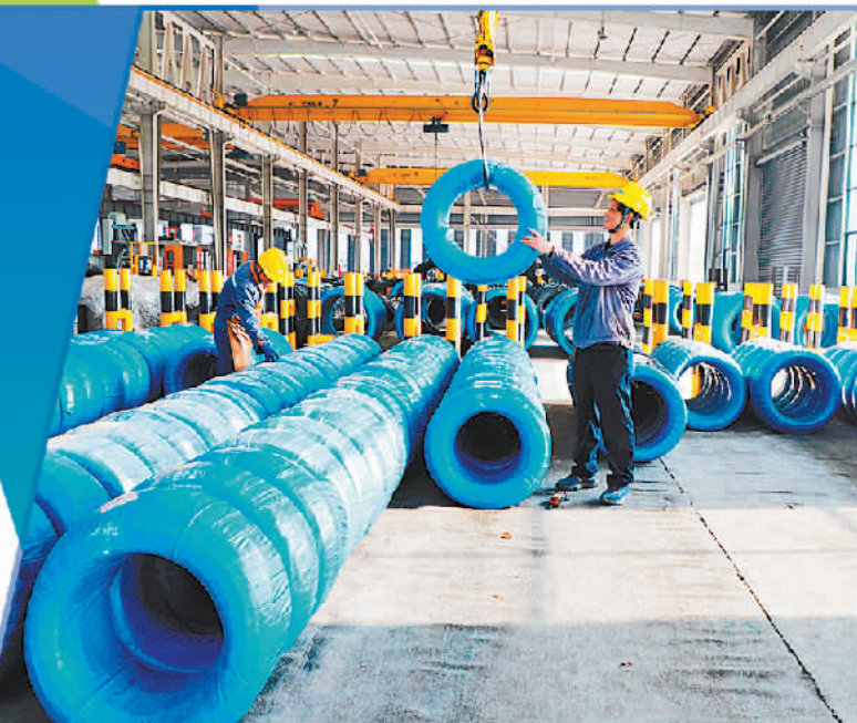
江西卓信新材料公司生产车间内,工人抓紧生产优质钢丝,满足市场需求。

数据显示,2022年,国内前10家钢企粗钢产量占全国比重为42.8%。产业人士预计,市场加快优胜劣汰,钢企联合重组将提速,不仅全行业集中度会提升,区域市场以及细分领域市场的集中度也将逐步提升。