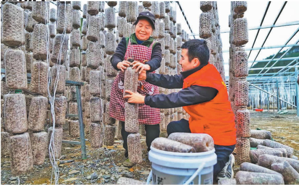
近日，湖南湘西凤凰县青年党员志愿者在帮助农户整理黑木耳菌棒。今年以来，凤凰组织新时代文明实践志愿服务队深入农村一线，开展志愿服务助农活动，助推全域文明创建。

吉林省税务局党委委员、总经济师田骅表示，吉林省税务部门将进一步创新税费服务举措，在服务吉林省科技创新、产业转型升级、民营经济健康发展等工作中，深化税商联动，强化税企直联，前置服务关口，为吉林全面振兴率先实现新突破作出新的更大贡献。