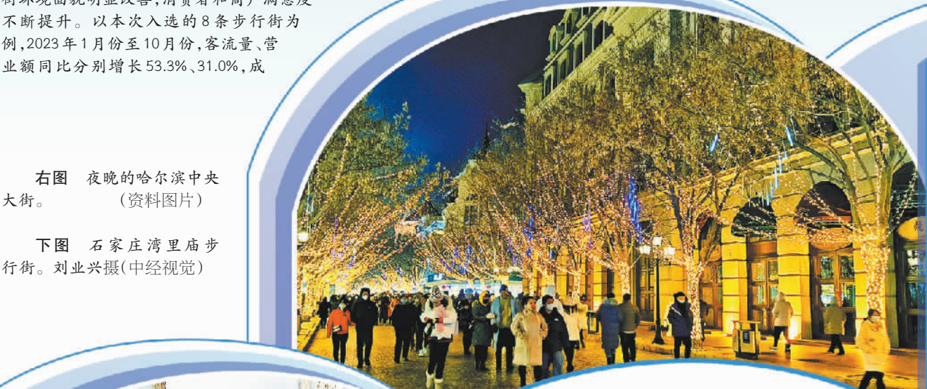
下图 石家庄湾里庙步行街。