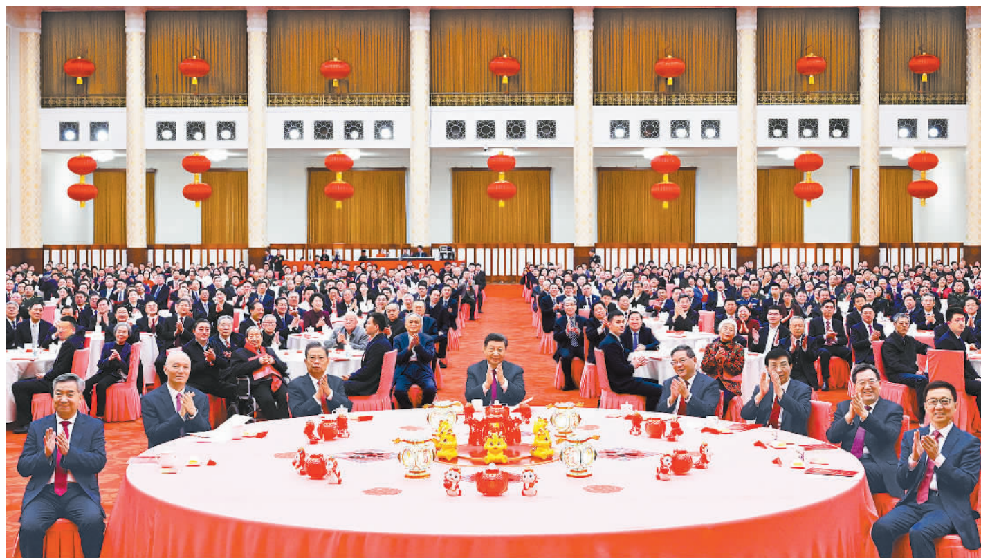
2月8日,中共中央、国务院在北京人民大会堂举行2024年春节团拜会。中共中央总书记、国家主席、中央军委主席习近平发表讲话。