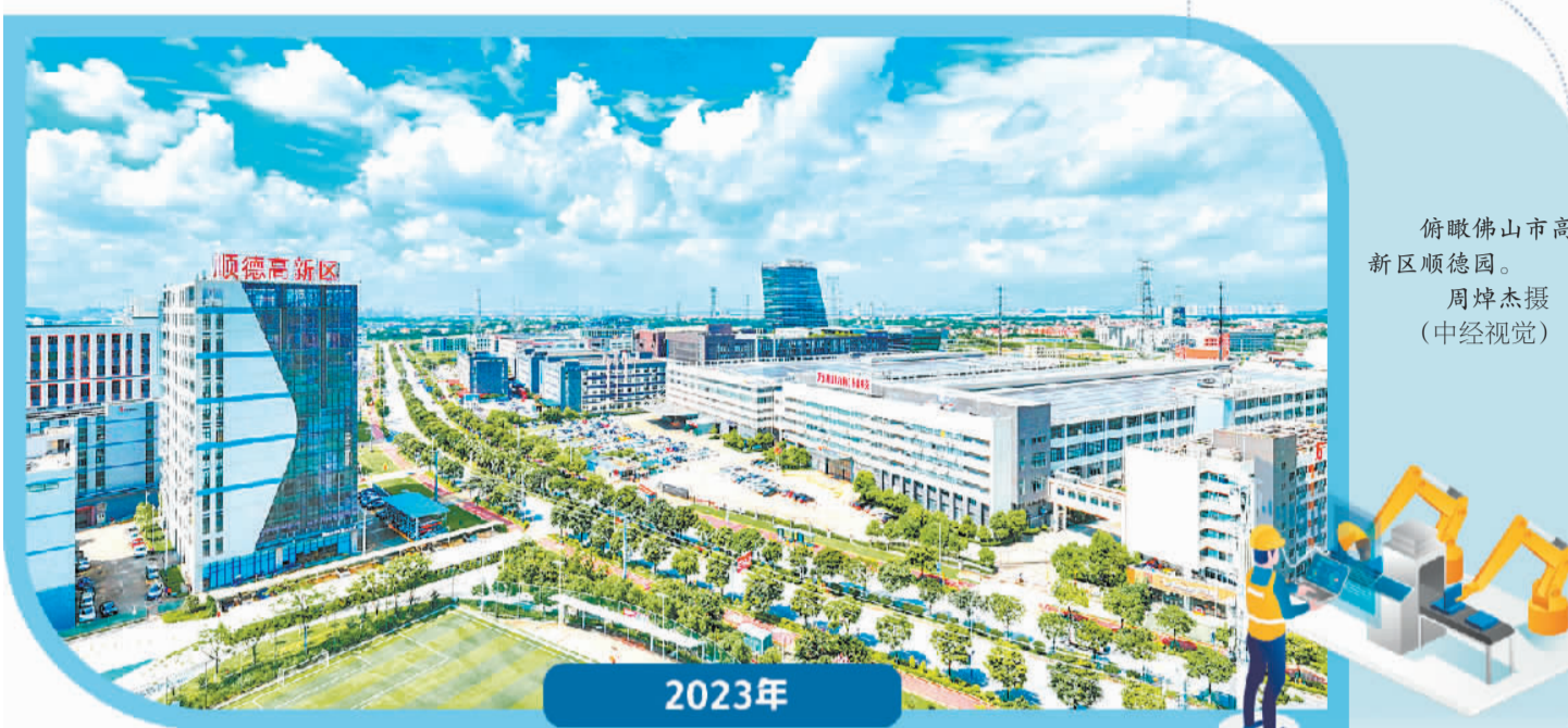
俯瞰佛山市高新区顺德园。

为此,顺德首先通过扩空间,给新兴产业迅速成长提供优质土壤。一方面,抓土地出让。顺德加强产业用地保障,探索对产业链关键环节实行整体规划供地,力争全年供应7000亩工业用地,确保优质企业、重点项目用地“应供尽供”。同时实施低效用地整治提升,将零散、低效的工业用地腾挪到工业集聚区,积极盘活批而未供土地和闲置土地,引导空间利用由“增量扩张”向“存量优化”稳步转变。在强有力的土地要素支撑下,顺德围绕高端装备、机器人、新能源、新一代电子信息等产业,大力开展以商招商、资本招商、产业链招商,重点引进先进制造业、现代服务业企业的区域性、功能性总部。