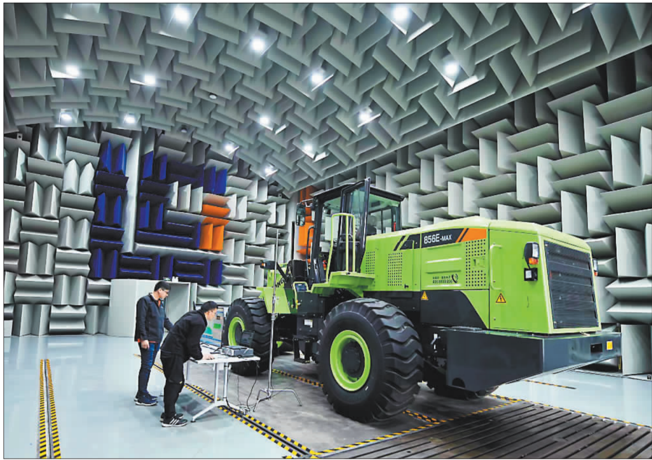
▲柳工机械股份有限公司员工在半消声试验室进行噪声测试。柳工在国内行业率先开展了工程机械声品质研究。

新兴产业加快培育壮大。瑞浦赛克电芯和电池系统、法恩赛克年产10万吨电解液（一期）、中车时代新能源驱动电机竣工投产，新能源汽车零部件本地配套率达60%，动力电池电芯产能达40.5GWh。优选机器人超级智慧工厂开工，国内首条氮化镓半导体激光器芯片投产，“星火·链网”超级节点（柳州）上线运营。2023年，预计新兴产业占全市工业产值比重达22%。