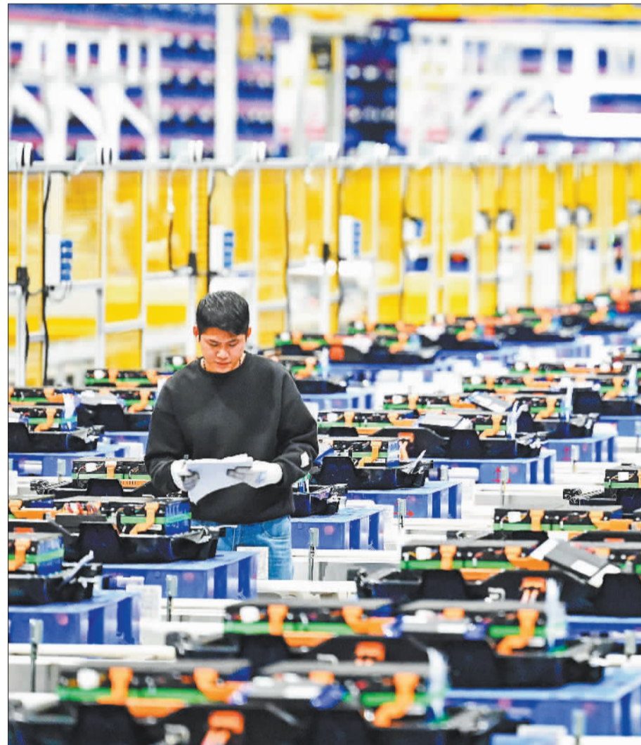
►柳州国轩锂电池生产基地，员工在检查新能源汽车电池包。柳州大力引进一批建链补链延链强链项目，助力新能源汽车产业快速发展。