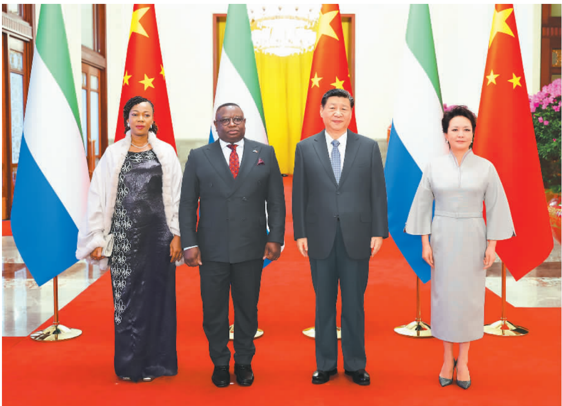
北京2月28日电 国家主席习近平28日在北京人民大会堂同塞拉利昂总统比奥举行会谈。这是会谈前，习近平和夫人彭丽媛同比奥总统和夫人合影。