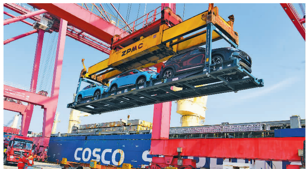
日前,在江苏省太仓港国际集装箱码头,汽车通过框架运输方式出口海外。今年前两个月,太仓港国际集装箱码头出口汽车2万余辆,出口量较去年同期大幅提升。

近年来,五峰人工种植天麻近6000亩,干天麻产量达4000多吨,天麻成为全县重要的致富产业。“传统的栽培模式每亩需15吨至18吨原木,长期以来让天麻成为该县‘不能丢、不能扶’的尴尬产业。”算起生态账,五峰大健康发展中心主任王陆青说,使用代料种植后,每亩仅需3吨至4吨树杈、灌木等辅材,全县2023年代料种植天麻已突破1000亩,收获鲜天麻3000多吨,收益达8000多万元。