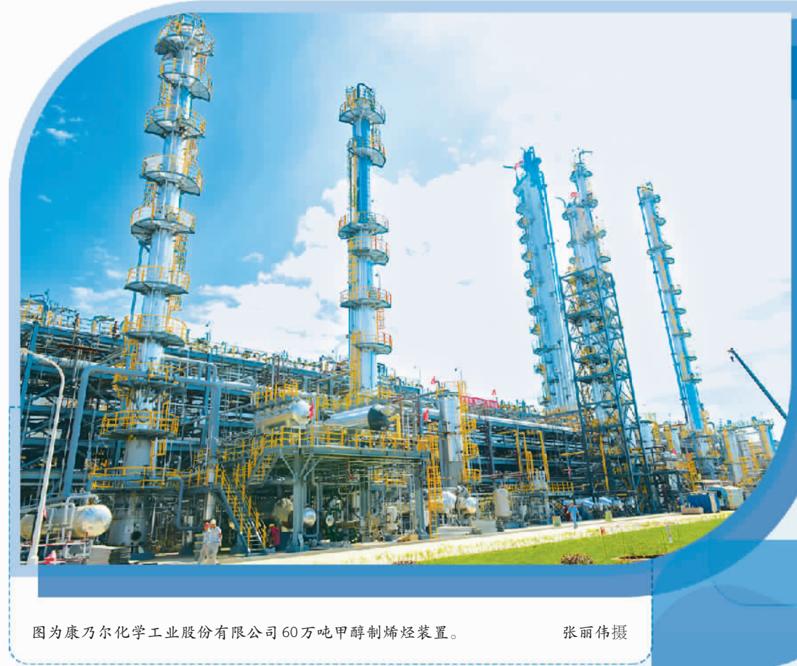
图为康乃尔化学工业股份有限公司60万吨甲醇制烯烃装置。

2023年,吉林经开区把盘活“双停”企业作为破解土地供应紧张、开发成本高一困局的“金钥匙”,制定停产、半停产企业及停缓建项目盘活攻坚实施方案,采取开拓市场、招商引资、股权转让、兼并收购、转型升级等办法,共盘活“双停”企业15家,激活土地面积153公顷,年度新增