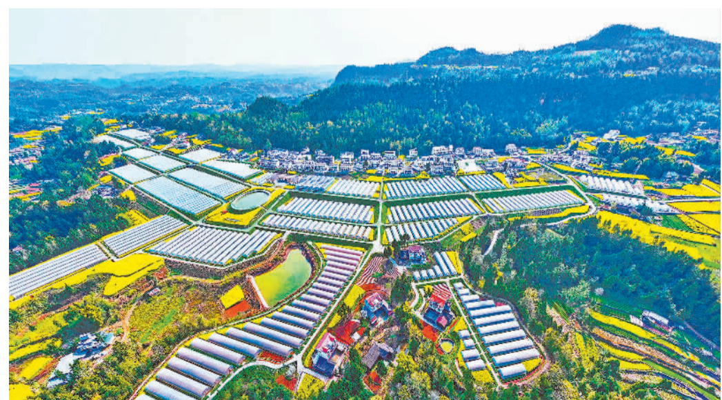
位于四川省巴中市恩阳区双胜镇的芦笋产业示范园,芦笋大棚与民居、油菜花、青山相映成趣。近年来,当地实施荒山荒坡和低产田综合改造,实现农业增效、农民增收。

能长红的城市都是“秀外慧中”。一座城市有山有水固然令人向往,如果还有对历史、文化、艺术的守护和热爱,那便能在人们心中打造出一片精神高地。不止网友“心动”,还能转化为游客想来、愿意再来的行动。可以说,有品质的城市自带流量,无需焦虑也不用“卷”。