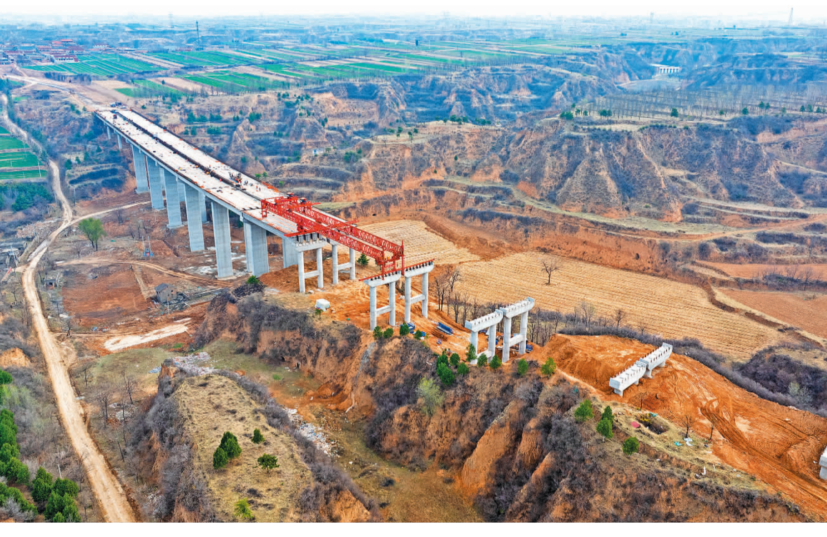
3月27日，山西省临汾市襄汾县南堡大桥施工现场，工人正在进行桥梁架设作业。南堡大桥为国道108项目重要控制节点工程，建成后有效缓解当地交通压力，促进区域互联互通。

王伟表示，在城区范围确定的基础上，可对我国城市化国土空间问题进行多维度分析。目前，城区范围确定成果已应用到国土空间规划编制和实施监测、城市空间监测和体检评估、城市地价动态监测、沿海城市地面沉降监测等国土空间监测分析工作中。