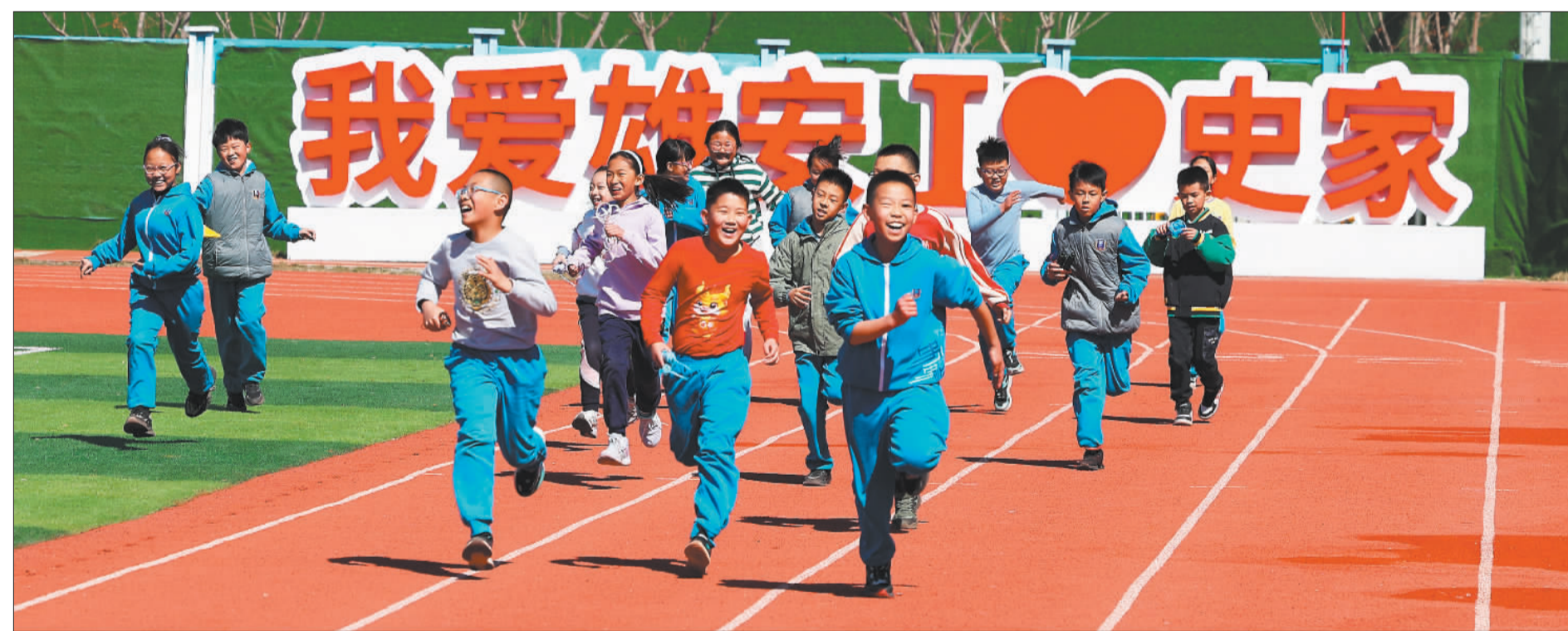
▲雄安史家胡同小学的孩子们在上体育课。雄安新区设立以来，雄安三县的教育硬件及软件焕然一新。