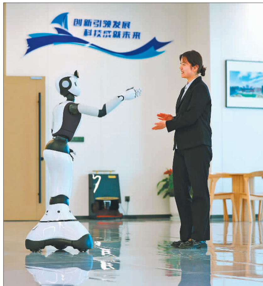
▲雄安新区科创中心雄安科技成果交易中心，机器人“雄雄”与工作人员互动。

展定位的市场化疏解项目；汇聚优质创新资源，推动更多国家级创新平台落地，探索开展新型研发机构事业单位设立工作；用足用好“雄才十六条”，加快建立以创新价值、能力、贡献为导向的人才评价体系，推动创新链、产业链、人才链、资金链、供应链、价值链“六链”融合发展，将雄安新区加快建设成为新时代创新高地和创业热土。