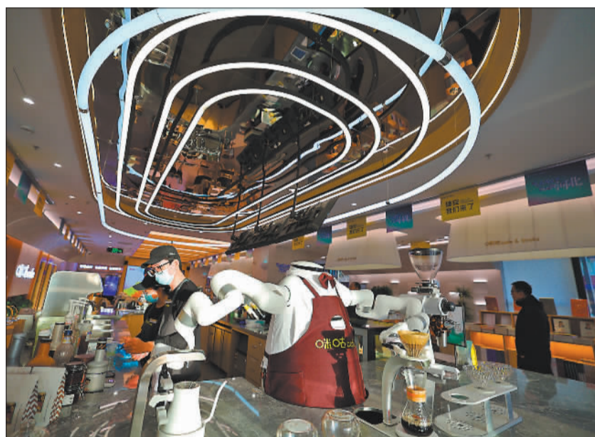
▼雄安新区中国移动科技创新体验中心咪咕咖啡店，“AI咖大师”在制作咖啡饮品。