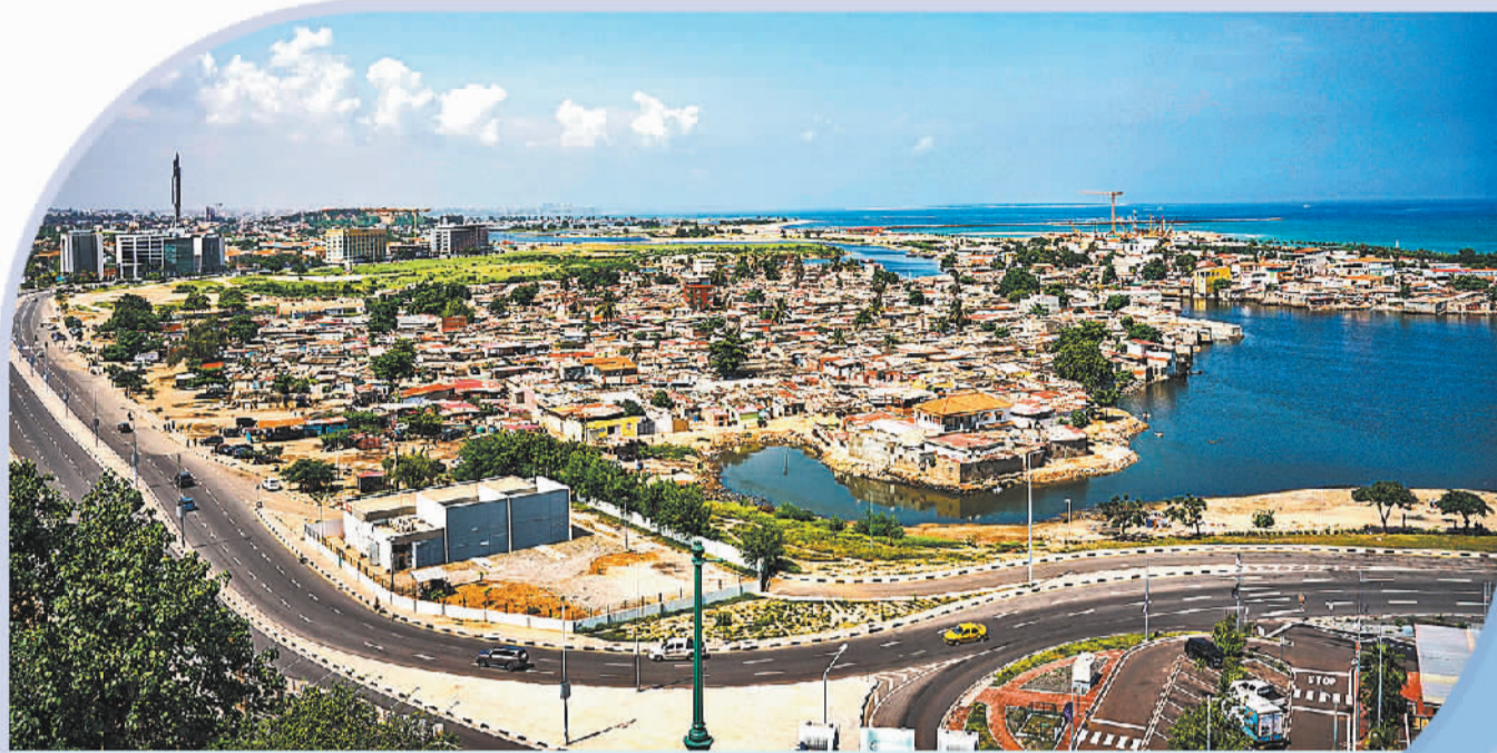
图为安哥拉首都罗安达的城市风光。