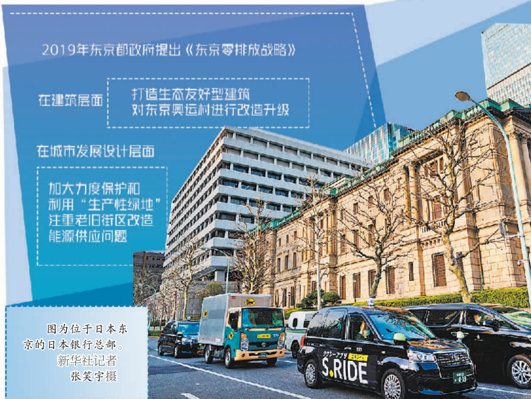
2019年东京都政府提出《东京零排放战略》

城市更新虽然提升了东京都的人文魅力和商业价值,但也带来了节能环保、绿色低碳等方面的压力。作为能源高度依赖进口的国家,日本不得不思考可持续发展的课题。为此,东京都政府于2019年提出了《东京零排放战略》。在建筑层面,东京都政府致力于打造生态友好型建筑,对超过一定规模的大型建筑物的环境性能进行评级和公布,要求新建筑符合高能效和低排放标准,通过提高绝缘性能、安装太阳能板、推广绿色建筑技术等,大幅减少温室气体排放量和能源消耗,将可再生能源的使用率提高到30%,最终实现“零能耗建筑”目标。东京都政府还努力对东京奥运村进行改造升级,将其打造成使用氢能源的智能能源区,作为向世界展示日本氢气供应系统和环境技术的窗口;在城市发展设计层面,东京都将保持绿化总量作为目标,加大力度保护和利用“生产性绿地”。包括向区和市提供补贴,购买生产性绿地,将其变成公园以及开放农场等公共设施,为老年人提供学习或从事农业活动的机