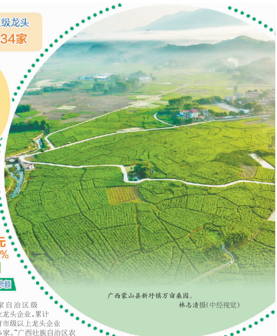
广西蒙山县新圩镇万亩桑园。

社+基地+农户”模式,成立芒果专业合作社55家,将平马文设、祥周新洲、林逢东养、那拔六鲁等10多个芒果标准生产示范基地打造成为集芒果种植、特色采摘、观光旅游等于一体的芒果产业示范带和产旅融合示范点。