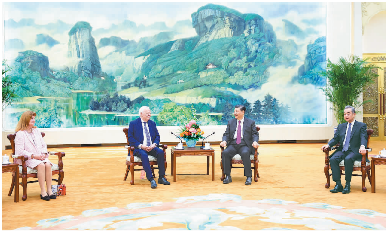
4月8日,国家主席习近平在北京人民大会堂会见法国梅里埃基金会主席梅里埃夫妇。