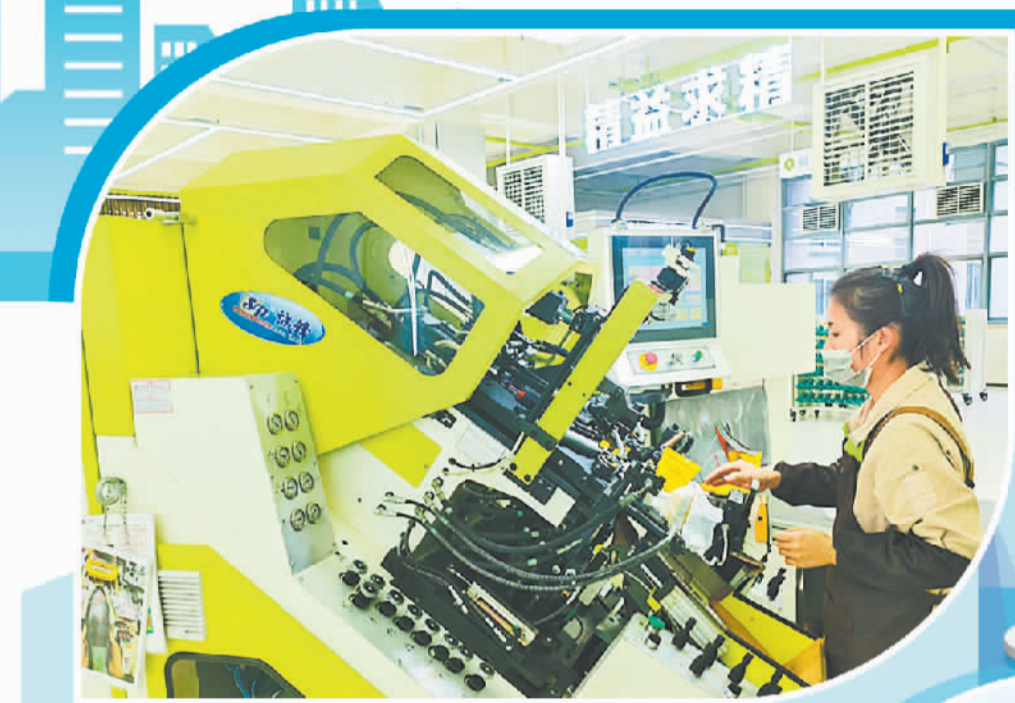
上图 在温州鹿城区的康奈智能工厂，员工在操作制鞋设备。 右图 中国(温州)数安港。