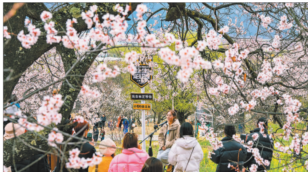
◀3月31日，林芝第21届桃花旅游文化节开幕，林芝漫山遍野的野生桃花次第绽放，全国各地的游客纷至沓来赏花观景。