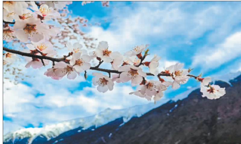
◀4月5日，那曲市嘉黎县尼屋乡盛开的桃花在雪山映衬下，格外美丽。