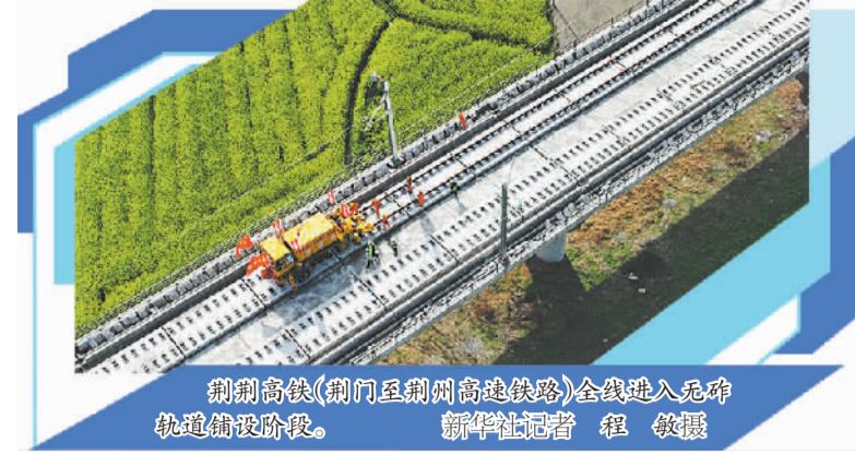
荆荆高铁(荆门至荆州高速铁路)全线进入无砟轨道铺设阶段。新华社记者 程 毅 摄