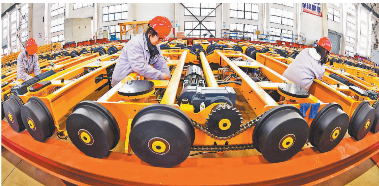
4月15日,江苏海安高新区天楹能源环保成套设备有限公司生产车间里,工人正在装配水平小车。今年以来,海安市进一步完善创新型中小企业梯度培育体系,着力推进单项冠军、专精特新“双名城”建设,增强发展动能。

杨波介绍,大庆高新区正围绕建设资源型城市转型发展示范区、东北创新创业集聚区、南北区域协同开放示范区、体制机制改革创新试验区的“四区”定位,全力推进哈大齐国家自主创新示范区建设;以体制机制创新和开放协同为核心动力,以优化创新创业生态和加速科技成果转化转移转化为重要抓手,全面提升自主创新能力和产业竞争力,打造全国资源型城市转方式、调结构、增动能的示范样板。