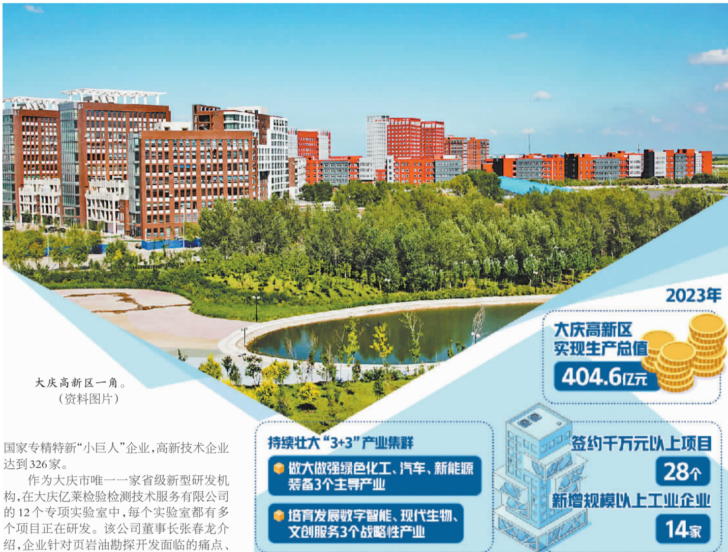
大庆高新区一角。(资料图片)

思特传媒科技的快速发展,是大庆高新区科技创新能力持续增强的一个缩影。2023年,大庆高新区深化政产学研合作,完善提升创新平台,加速科技成果转化,全年实现技术合同登记成交325项,成交额2.71亿元,66家企业获批省级创新型中小企业、