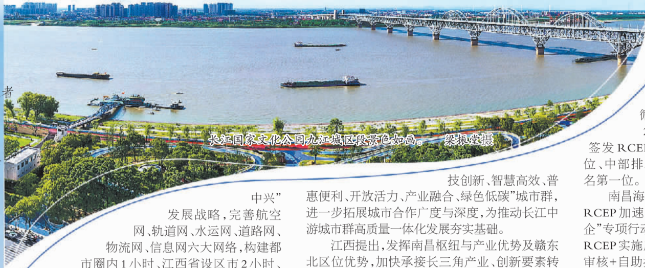
长江国家文化公园九江城区段景色如画。

翻开江西地图,鄱阳湖犹如一个缀在万里长江“玉带”上的宝葫芦。千河归一湖,一湖入长江,这是江西独有的地理特性。长江在江西这片红土地上留下了宽阔又有活力的152公里黄金水道。