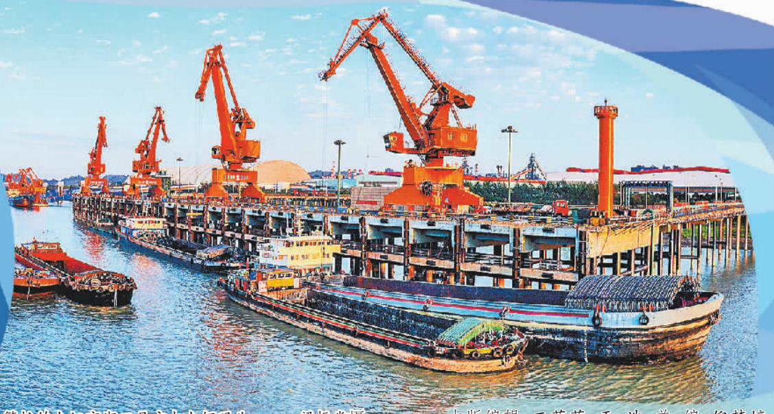
繁忙的九江市湖口县方大九钢码头。

以更大力度深化对内对外开放,以更实举措打造内陆地区改革开放高地,必将为江西高质量发展增添新动力、拓展新空间。