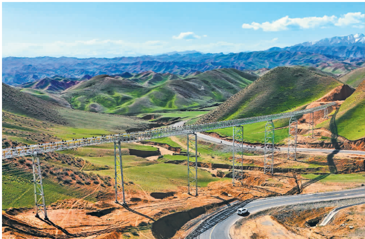
4月21日,新疆昌吉回族自治州呼图壁县输煤廊道穿梭于山间。为改善沿线生态环境,实现“运煤不见煤”,当地启动输煤廊道及煤炭物流枢纽中心项目建设,项目东线输煤廊道全长34.5公里,总投资约5亿元。

《论述摘编》分7个专题,共计248段论述,摘自习近平同志2012年12月至2024年3月期间的报告、讲话、指示、批示、贺信、回信等110多篇重要文献。其中部分论述是第一次公开发表。