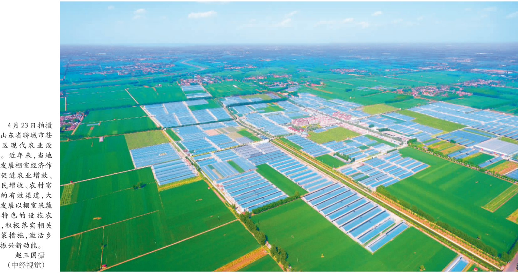
4月23日拍摄的山东省聊城市茌平区现代农业设施。近年来,当地把发展棚室经济作为促进农业增效、农民增收、农村富裕的有效渠道,大力发展以棚室果蔬为特色的设施农业,积极落实相关政策措施,激活乡村振兴新动能。

辽宁振兴,人才是关键要素。2023年辽宁省人口净流入8.6万人,一举扭转了连续11年人口净流出局面。辽宁省委常委、副省长张立林说,这个变化是辽宁经济发展向上、产业向新、环境变好、经济活力更足的集中体现。近年来,辽宁创造更多岗