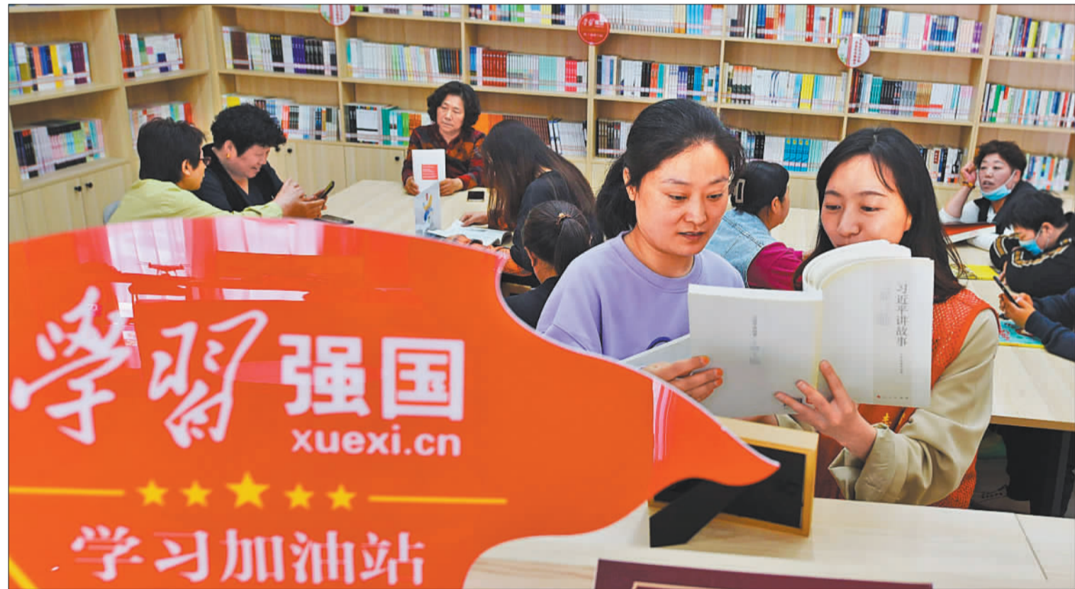
▼4月23日，河北省迁安市永顺街道开展“让书香飘满网格”主题阅读活动，志愿者和居民共同分享阅读体会和读书感悟。