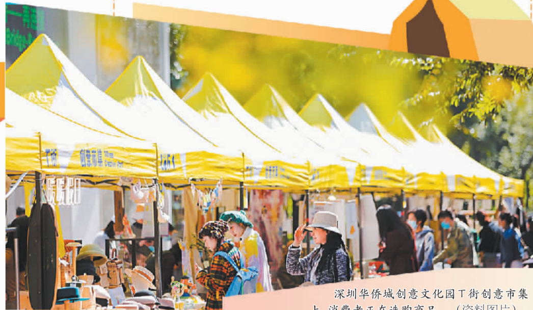
深圳华侨城创意文化园T街创意市集上，消费者正在选购商品。（资料图片）

趣的交流互动氛围。这些活动自带社交属性，更符合年轻消费者对不同社交消费场景的需求。同时，多频次、拼块式、小而美的户外市集通常设置在购物中心、核心商圈、创意街区，有助于为主流消费场景聚人气、引入流，进而带动多场景消费。