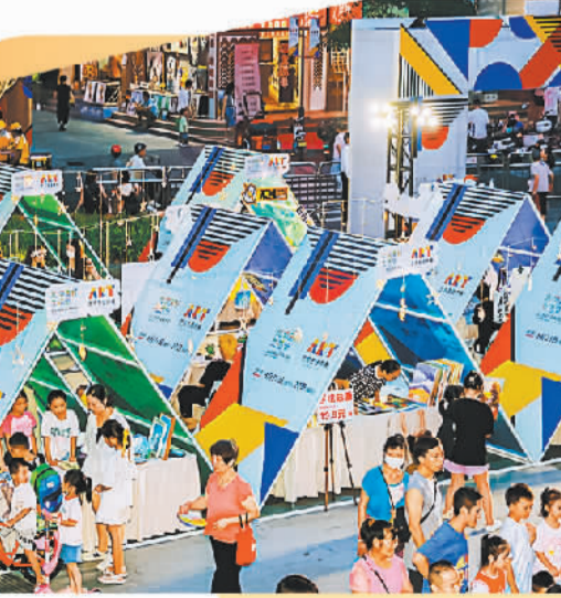
深圳市龙岗区的美好生活节“为美好加FUN艺术生活市集”现场。（资料图片）

创办于2008年的T街创意市集位于深圳华侨城创意文化园，如今已成为国内开办周期最密集、场地设施最稳定的街区型创意市集，也是深圳重要的文化创意活动品牌。“我们每月举办2期市集活动，根据地点不同设有60个至88个摊位，目前已举办了260期。”深圳华侨城创意文化园运营负责