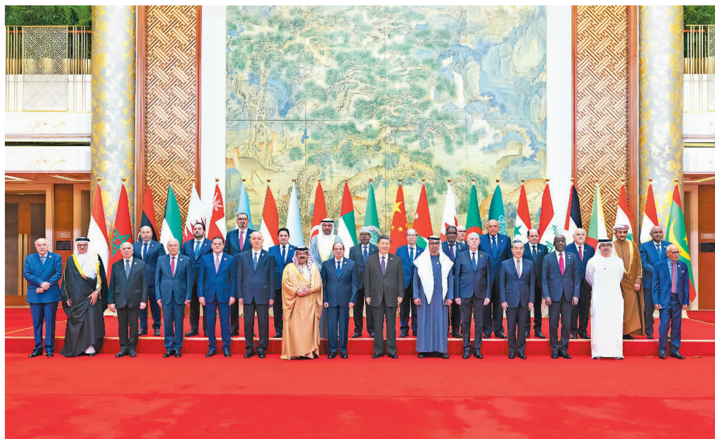
5月30日上午,国家主席习近平在北京钓鱼台国宾馆出席中阿合作论坛第十届部长级会议开幕式并发表主旨讲话。