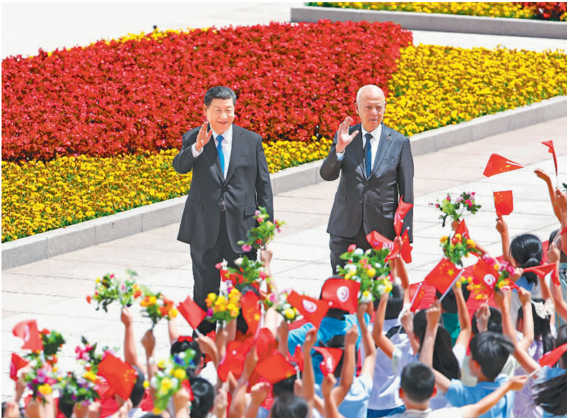
习近平在人民大会堂东门广场为赛义德总统举行欢迎仪式...

新华社北京5月31日电(记者郑明达、王宾)5月31日上午,国家主席习近平在北京人民大会堂同来华国事访问并出席中国—阿拉伯国家合作论坛第十届部长级会议开幕式的突尼斯总统赛义德举行会谈。两国元首宣布,建立中突战略伙伴关系。 习近平指出,中国和突尼斯是好朋友、好兄弟。建交60年来,无论国际风云如何变幻,中突双方始终相互尊重、平等相待、彼此支持,谱写了发展中国国家风雨同舟、守望相助的生动篇章。巩固好、发展好中突关系,符合两国人民的根本利益和共同期待。中方愿同突方一道,赓续传统友谊,深化各领域交流合作,推动中突关系迈上新台阶。今天我们宣布建立中突战略伙伴关系,必将开辟两国关系更加美好的未来。 习近平强调,中方支持突尼斯走符合自身国情的发展道路,支持突方独立自主推进改革进程,将命运牢牢掌握在自己手中。中方愿同突方加强发展战略对接,深化基础设施建设、新能源等领域合作,培育医疗卫生、绿色发展、水资源、农业等领域合作新动能,推动两国高质量共建“一带一路”取得更多成果。欢迎更多突尼斯优质特色产品进入中国市场。中方愿继续向突尼斯派遣高水平医疗队,同突方深化教育、旅游等领域合作,密切人文交流。双方要同“全球南方”国家一道,加强团结协作,践行真正的多边主义,倡导平等有序的世界多极化和普惠包容的经济全球化,实现共同发展。中方愿同突方一道努力,建好中阿合作论坛、中非合作论坛,为中阿关系发展注入新动力,携手构建高水平中非命运共同体。 赛义德表示,很高兴在突中建交60周年之际对中国进行历史性访问并出席中阿合作论坛第十届部长级会议开幕式。突中两国友谊深厚、理念相通,各领域合作成果丰硕。突方期待在国家发展进程中得到中方更多支持,密切卫生、交通、绿色发展、教育等领域合作,将突中关系提升到新水平。突方坚定奉行一个中国政策,坚定支持中国政府为实现国家统一和捍卫核心利益所作努力。突方和阿拉伯国家赞赏中华优秀传统文化理念,赞赏中方在国际事务中主持公道正义。每一个国家都有权自主选择符合自身国情的发展道路。突方愿同中方秉持全人类共同价值,密切团结协作,反对霸权主义和阵营对抗,创造更加平等美好的世界,让世界各国人民能够享受真正的人权和自由,和谐共存,共享和平、安全与繁荣。(下转第二版)