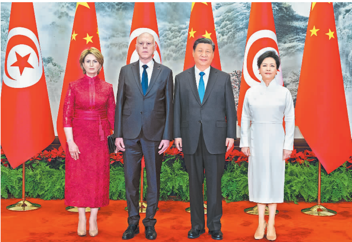
伊... 五月三十一... 阿拉伯国家合作... 这是会谈前... 国家主席习近平在北京人民大会堂同来华国事访问... 习近平和夫人彭丽媛...... 行... 五月三十一... 这是会谈前... 国家主席习近平在北京人民大会堂同来华国事访问...