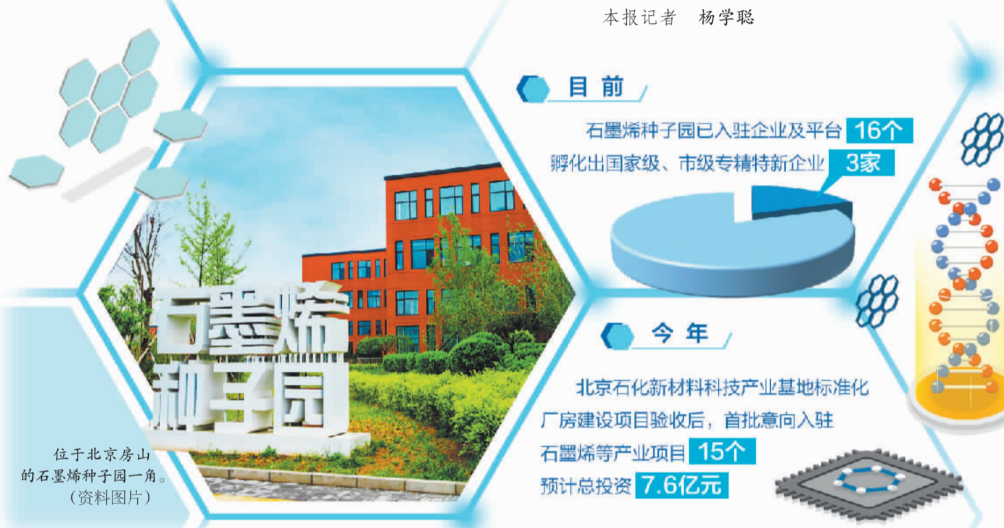
位于北京房山的石墨烯种子园一角。(资料图片)

将打造石墨烯特色产业集群列入发展目标,北京先进材料产业促进会落地燕山、京津冀碳谷北京产业园签约招商……作为北京市唯一的新材料产业聚集地,房山区已经在新材料领域占得一席之地。在京津冀协同发展的大背景下,房山区用先进材料串起区域协同创