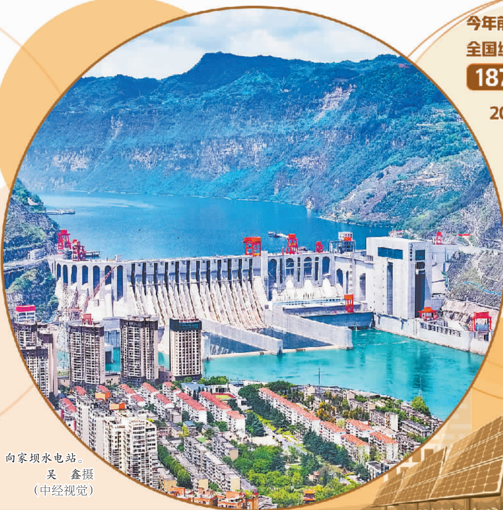
向家坝水电站。