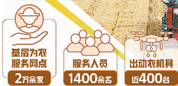
江苏省盐城市射阳县江苏农垦新洋农场,数台大联合收割机在抢收小麦。