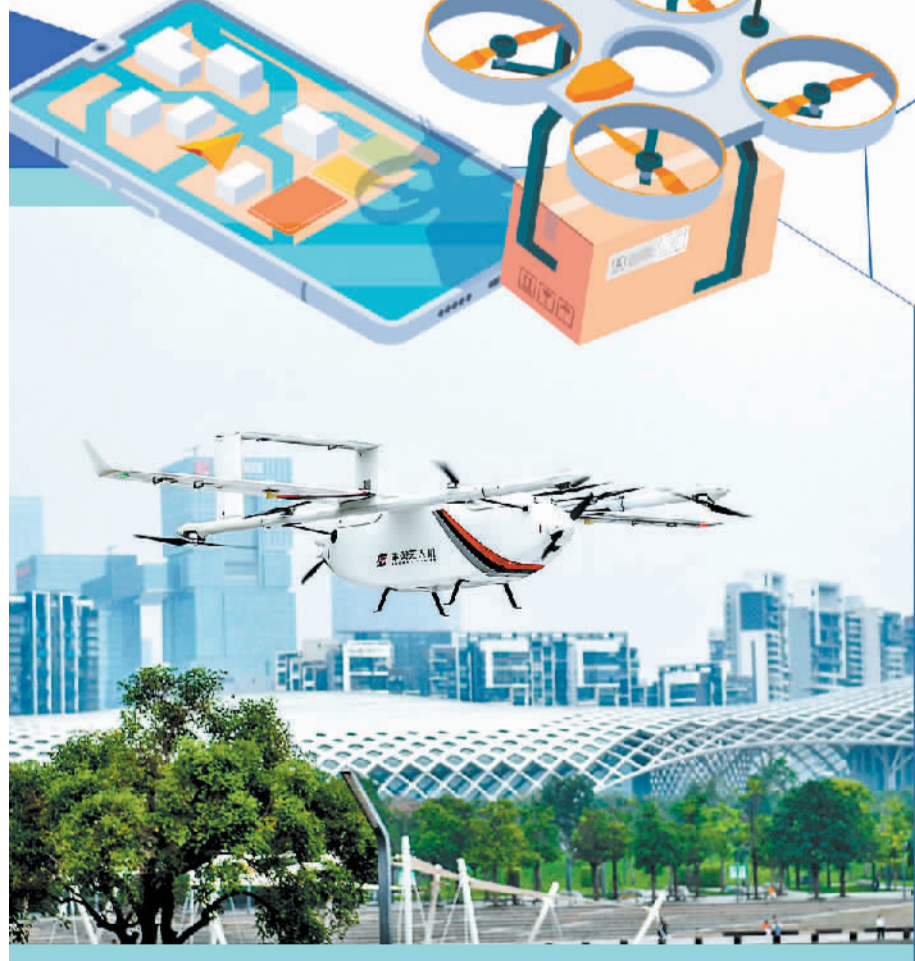
丰翼无人机正载着货物飞跃深圳人才公园。

顺丰控股董事长兼总经理王卫表示，当前，快递行业和场景的物流需求更加多元化，单一标准产品无法完全满足客户需求。顺丰控股将围绕行业发展情况及细分场景，结合完整的产品矩阵，形成可快速复制的解决方案和组合套餐服务，提高销售协同能力，扩大在不同行业客户的物流份额和业务增量。同时，公司将通过整合科技系统、智能化技术等助力业务发展，对推动增收降本的科技倾注更多资源，并且结合人工智能的应用进一步提升效率。