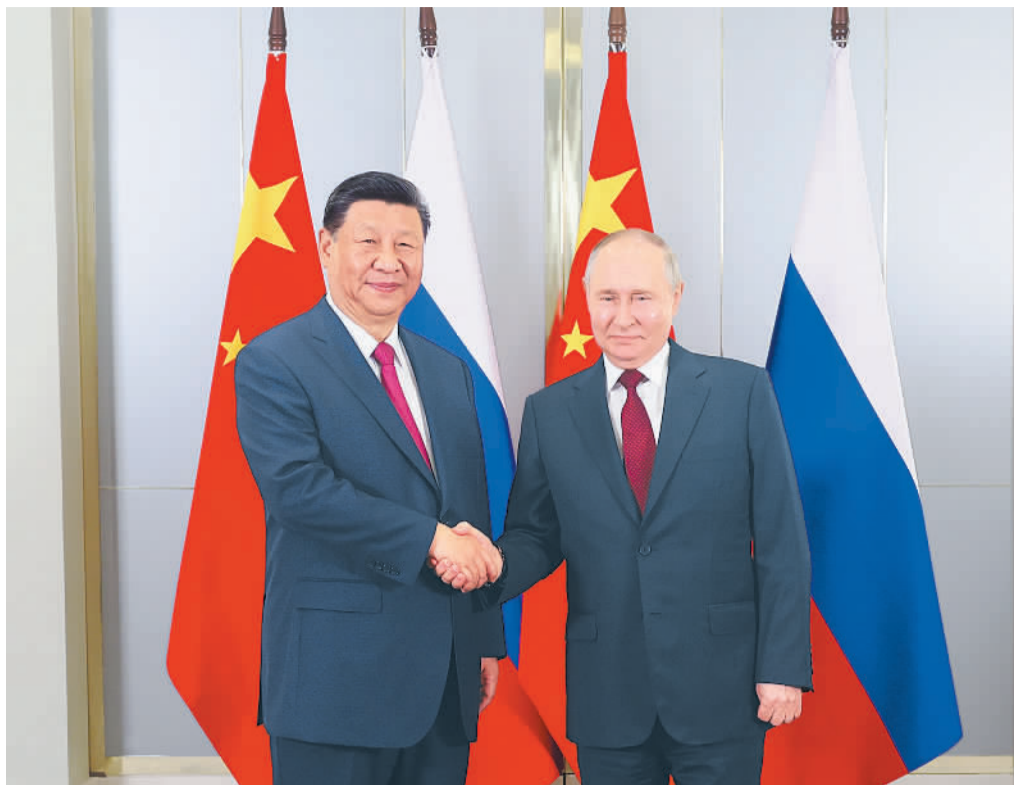
当地时间7月3日晚,国家主席习近平在阿斯塔纳出席上海合作组织峰会前会见俄罗斯总统普京。

习近平强调,中俄要继续加强发展战略对接和国际战略协作。中方支持俄方履行好金砖国家轮值主席国职责,团结“全球南方”,防止“新冷战”,反对非法单边制裁和霸权主义。明天将举行上海合作组织阿斯塔纳峰会。中方期待同俄罗斯和各成员国一道,推动本组织发展行稳致远,打造