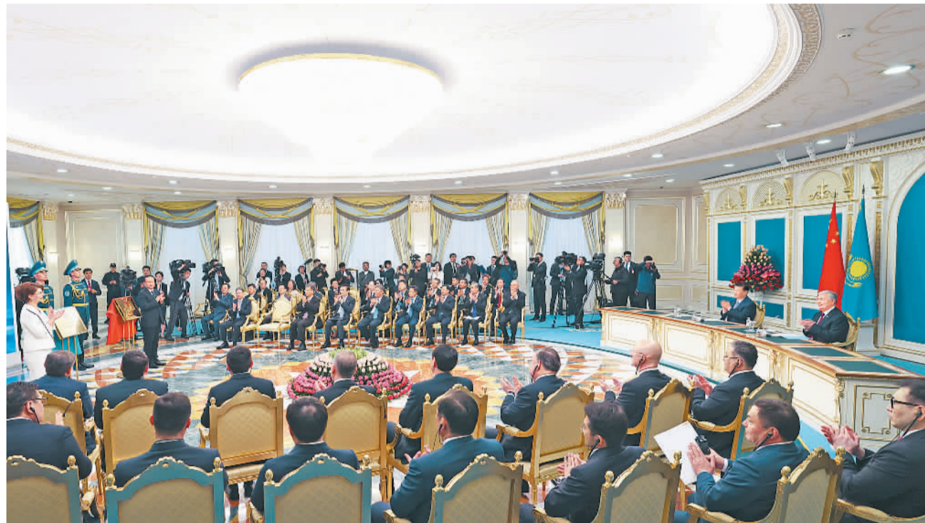
当地时间7月3日中午,国家主席习近平同哈萨克斯坦总统托卡耶夫在阿斯塔纳总统府共同出席阿斯塔纳中国文化中心、北京哈萨克斯坦文化中心和北京语言大学哈萨克斯坦分校揭牌仪式。

更加紧密的上海合作组织命运共同体。中俄双方要继续加强全面战略协作,反对外部干涉,共同维护本地区安宁稳定。(下转第四版)