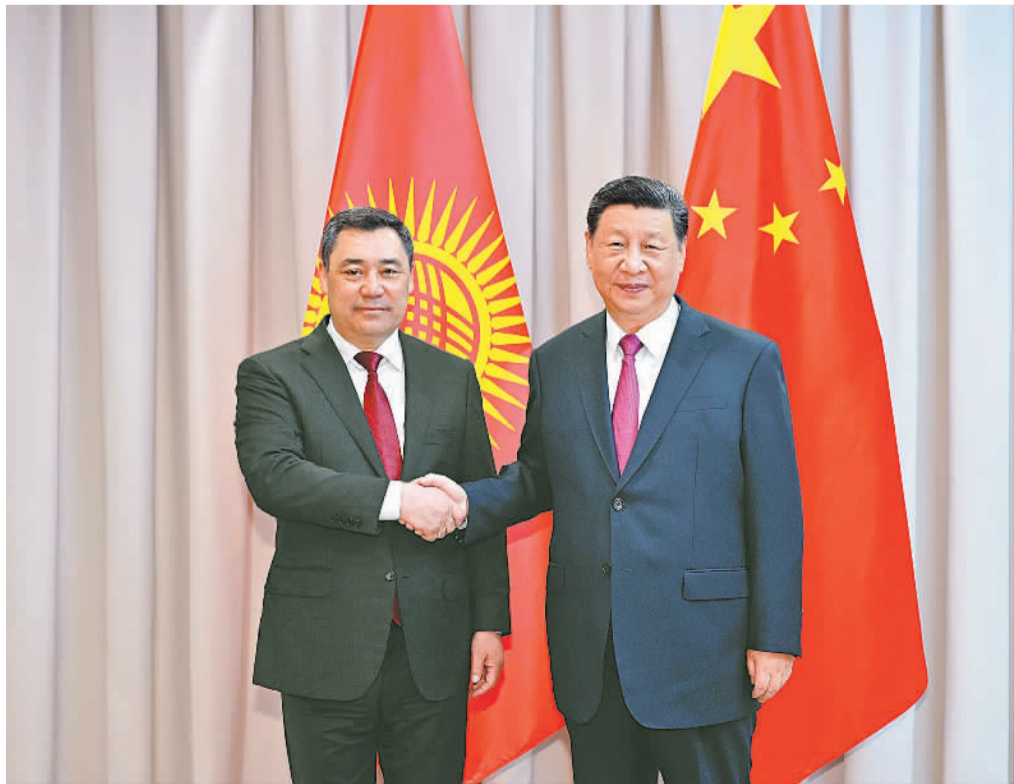
当地时间7月3日下午,国家主席习近平在阿斯塔纳出席上海合作组织峰会前会见吉尔吉斯斯坦总统扎帕罗夫。

会谈后,两国元首共同签署《中华人民共和国和哈萨克斯坦共和国联合声明》,并共同见证交换经贸、互联互通、航空航天、教育、媒体等领域数十项双边合作文件。当天中午,习近平出席了托卡耶夫总统举行的隆重欢迎宴会。蔡奇、王毅等参加上述活动。