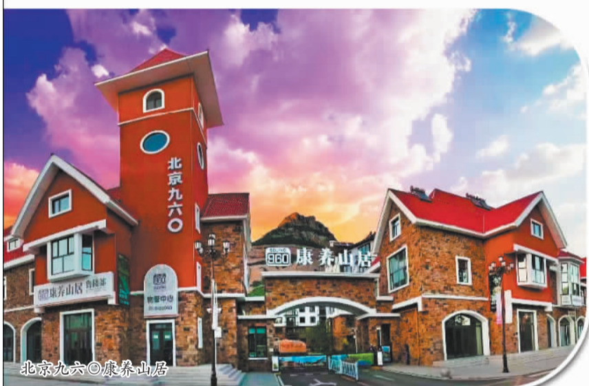
北京九六〇康养山居