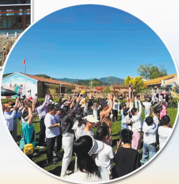
孩子们在卡布番茄小镇研学