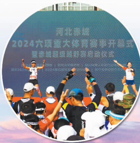
2024六项重大体育赛事开幕式暨赤城超级越野赛启动仪式