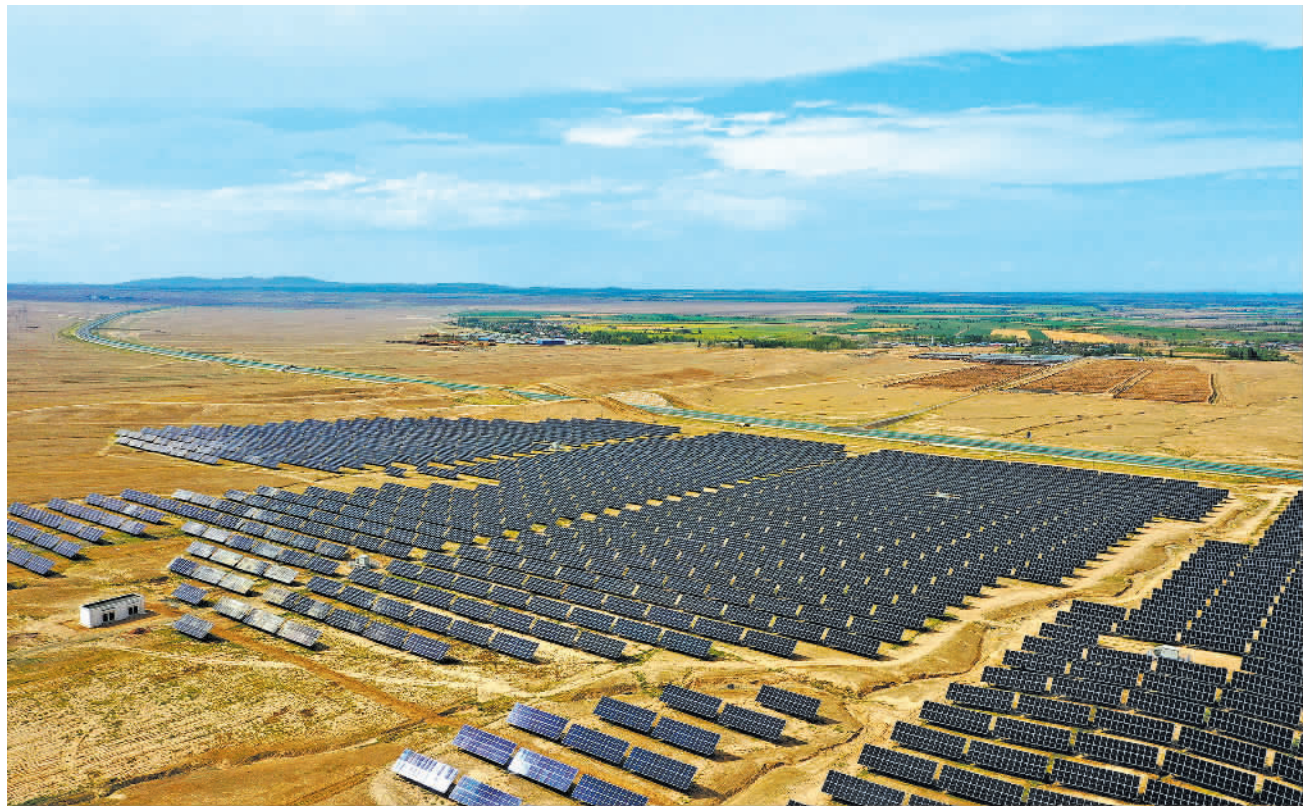
8月12日拍摄的新疆昌吉市畜牧产业园30兆瓦分布式光伏项目一期18兆瓦光伏项目。该项目投资1.6亿元,为当地首个自治区级光伏发电重点项目,目前已基本完工,计划本月底并网发电。

还要下大力气深化债券市场建设、推动资本市场改革,不断提高直接融资在民营企业融资中的比重。要进一步完善股票发行和再融资制度,充分释放市场机制活力,提高民营企业在资本市场募集资金的能力。立足民营企业实际情况和真实需求,协同发展多层次资本市场体系,支持符合条件的民营企业在科创板、创业板、北交所以及区域性股权市场等上市、挂牌。发挥民营企业债券融资支持工具作用,支持民营企业债券发行、扩大定向可转债适用范围试点以及创新创业试点,扩大民营企业股权融资和债权融资规模,拓宽企业多元化融资渠道,支持民营企业做大做强。