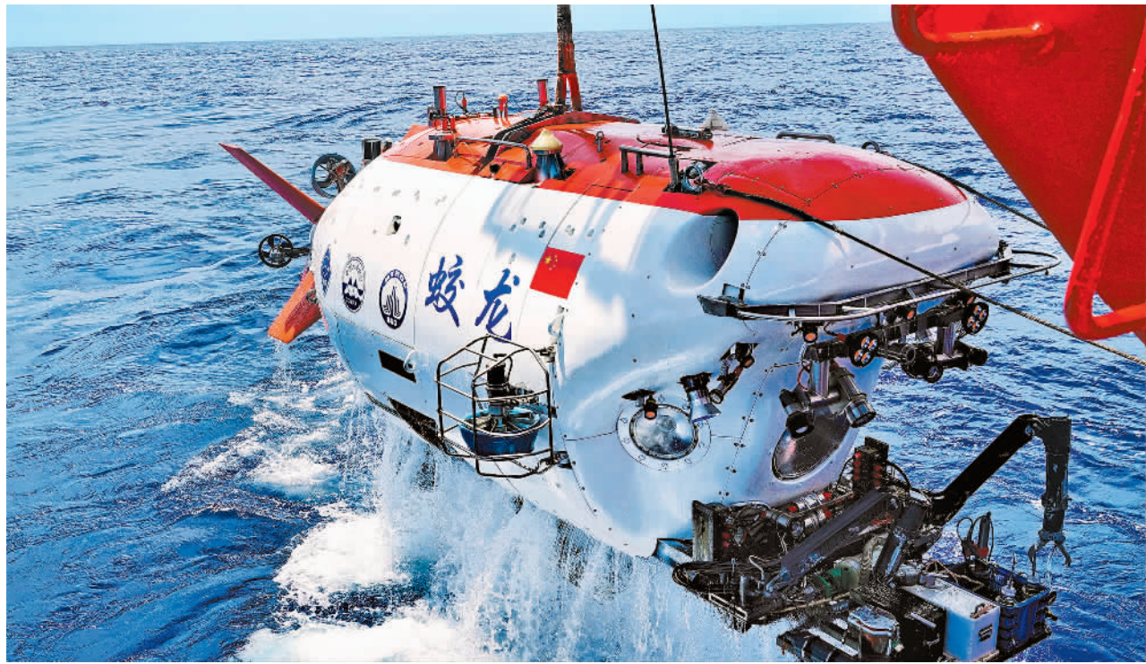
8月18日,“蛟龙号”在西太平洋海域完成下潜出水。2024西太平洋国际航次科考队18日在西太平洋海域顺利完成“蛟龙号”航次首潜,这也是“蛟龙号”的第300次下潜。