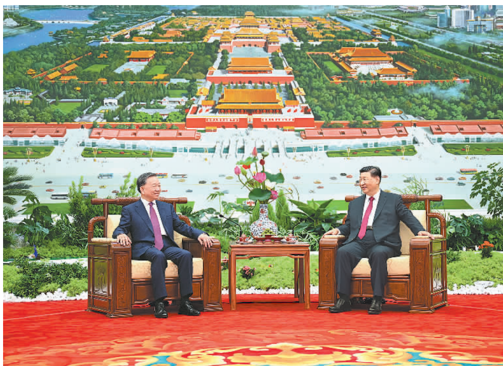
8月19日,中共中央总书记、国家主席习近平在北京人民大会堂同来华进行国事访问的越共中央总书记、国家主席苏林举行会谈。这是习近平同苏林进行小范围茶叙。新华社记者 谢环驰摄

运共同体和全球发展倡议、全球安全倡议、全球文明倡议。越方愿同中方密切多边国际协作,维护多边主义,维护国际公平正义,为促进世界和平与发展作出积极贡献。 会谈后,双方共同见证签署关于党校、互联互通、工业、金融、海关检验检疫、卫生、新闻机构和媒体、地方、民生等领域多项双边合作文件。 签字仪式后,习近平同苏林进行小范围茶叙,在亲切友好的氛围中就共同关心的重要问题继续进行深入交流。 会谈前,习近平和夫人彭丽媛在人民大会堂东门外广场为苏林和夫人吴芳瑞举行欢迎仪式。