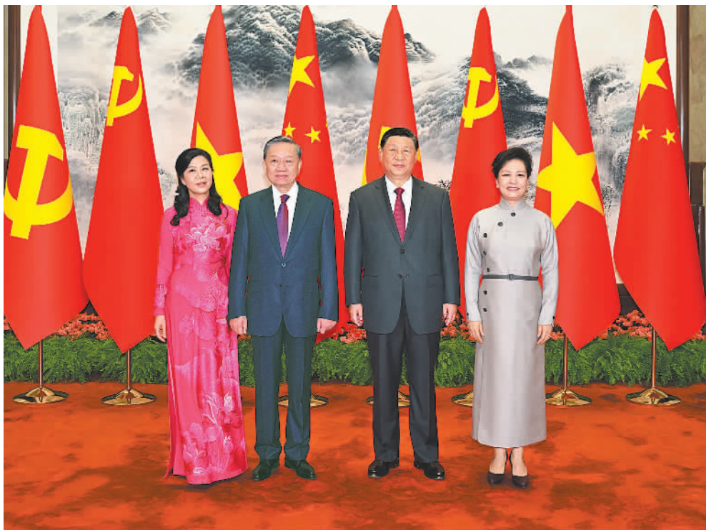
8月19日,中共中央总书记、国家主席习近平在北京人民大会堂同来华进行国事访问的越共中央总书记、国家主席苏林举行会谈。这是会谈前,习近平和夫人彭丽媛同苏林和夫人吴芳瑞合影。