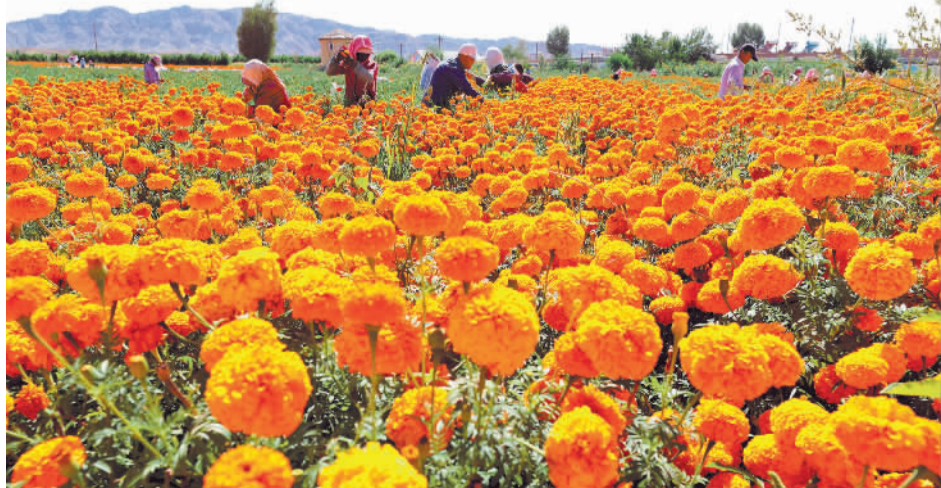
8月21日，甘肃省张掖市山丹县清泉镇双桥村如意花海万寿菊种植基地内，花农们正在采摘万寿菊。当地推动“农业种植+文化旅游”融合发展，种植的百万株万寿菊不仅成为促进农户增收的特色产业，更成为乡村旅游新亮点。

“我们将把方正打造成为优势产业集聚地、现代农业排头兵、乡村振兴示范区，不断优化营商环境，筑巢引凤，持续优化产业布局、壮大产业规模，推动资源向项目聚集、要素向项目聚拢、力量向项目聚合，以高质量项目支撑高质量发展。”郑伟说。