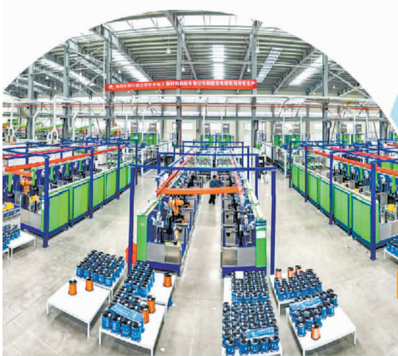
江西铜业股份有限公司投资新建的10万吨新能源电磁线项目生产车间。

作为传统产业大省，江西抓住新一轮政策机遇，推动企业设备更新和技术改造，在加快推进传统产业转型升级的同时，促进中小企业朝专精特新发展。上半年，全省工业投资同比增长11.5%，比一季度加快7.6个百分点；工业技改投资增长7.1%，占工业投资