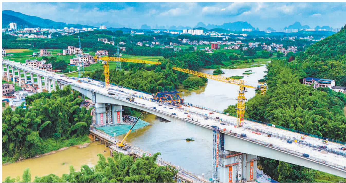
8月21日，在广东清远连山至广西贺州高速公路江特大桥项目建设现场，建设人员正加紧施工作业。该项目建成后将进一步完善广西高速公路网络，对粤桂两省区交通互联互通起到重要作用。