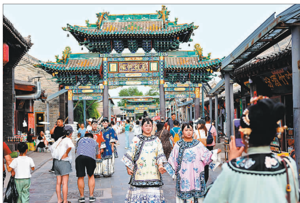
▲8月13日,身着传统服饰的游客拍照打卡,体验着古韵与时尚交融的平遥之旅。旅拍正成为平遥文旅消费新热点,商家已发展至500余家,吸纳摄影、化妆、民宿等相关从业人员近4000人。