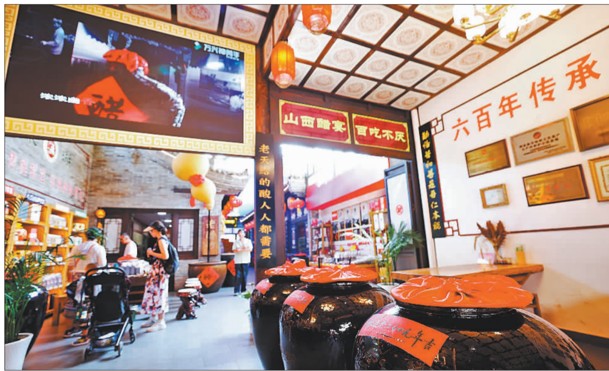
▲8月13日,平遥古城东湖老醋坊,醋文化展示引人注目。近年来,传统老醋尝试跨界融合,推出陈醋元宵、陈醋月饼、陈醋冰淇淋等产品,赋予老味道新感受。