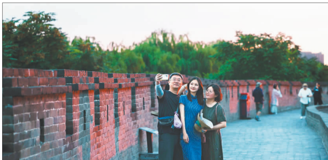
▼8月12日拍摄的平遥古城城墙。城墙横亘绵延6000多米,围成面积2.25平方公里的封闭城池,城内保存着300余处文物、近4000处传统建筑,大量传统文化在日常生活中活态传承。