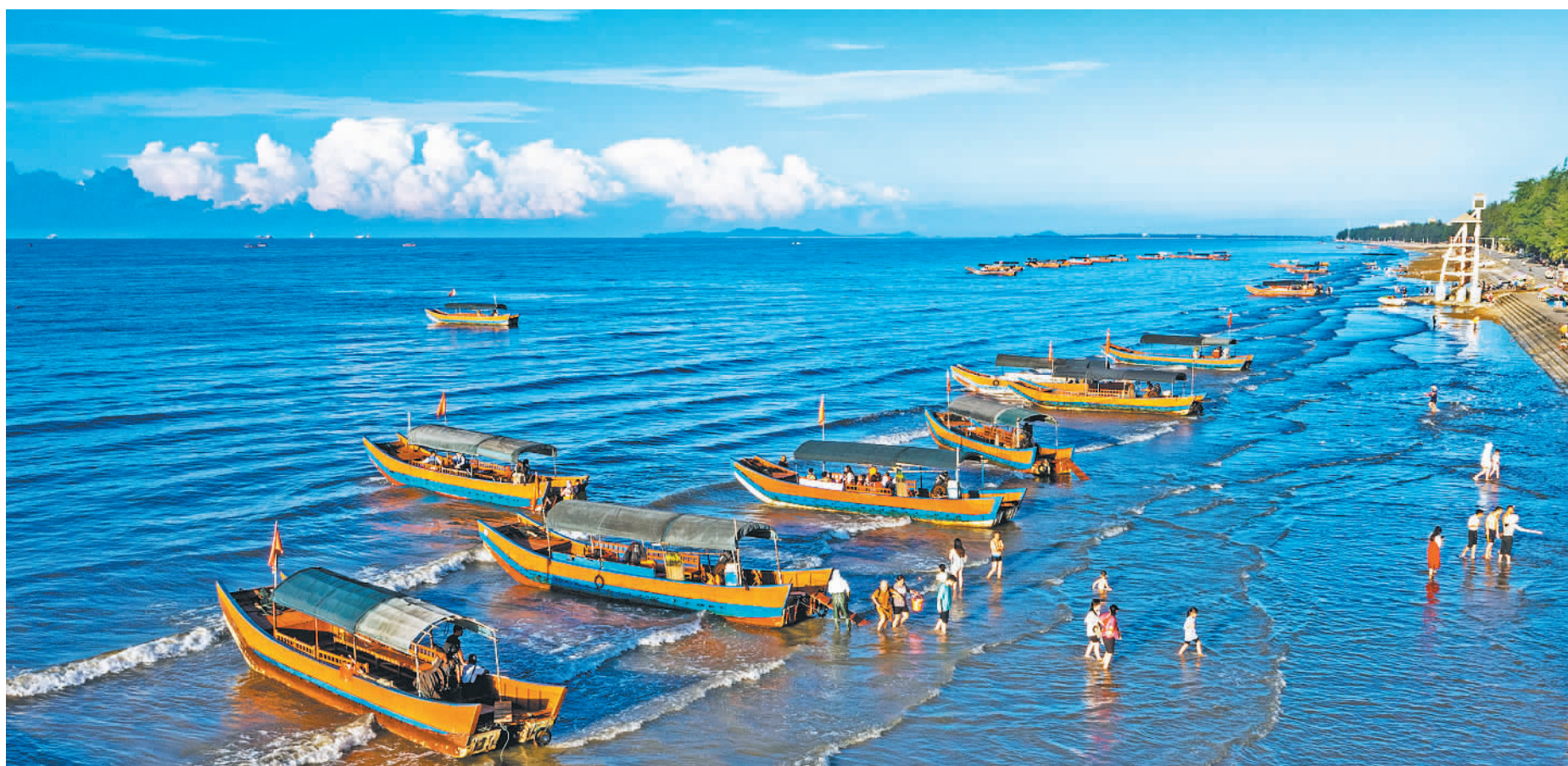
8月26日,广西壮族自治区防城港市东兴万尾金滩,碧海蓝天、景色宜人的旅游环境,吸引各地游客纷至沓来。

税务总局有关司局负责人表示,税务部门将继续把组织收入工作置于经济社会发展大局中推进落实,进一步坚持依法依规征税收费,优化执法方式,坚决不收“过头税费”,不搞集中性征缴过往期,不折不扣落实好结构性减税降费政策,让执法既有力度又有温度,促进经营主体稳定预期、增强信心,为服务中国式现代化创造良好的税收环境和财力保障。